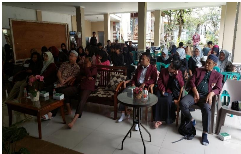
Sumber: Dokumentasi PKM