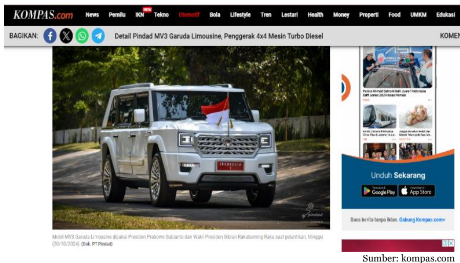
Gambar 1 Kendaraan produk anak bangsa MV3 Garuda Limousine

Sorotan tertuju pada kendaraan produk PT Pindad Maung MV3 Garuda Limousine yang digunakan Presiden RI Prabowo Subianto saat menyusuri jalanan Jakarta menuju ke Gedung MPR untuk menjalani proses pelantikan. Jagat media gempar karena baru kali pertama menyaksikan kendaraan yang diklaim sebagai produk lokal dengan kualitas global.