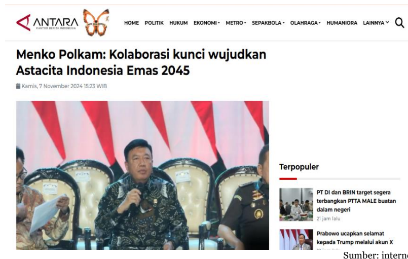
Gambar 2 Program bangsa menuju Indonesia Emas

Dengan dua momen positif ini efek yang ditimbulkan sangat dahsyat. Apalagi jika ditambah dengan prestasi-prestasi kelas dunia lainnya yang kemudian menggaung ke seluruh dunia dapat menumbuhkan persepsi positif warga dunia kepada bangsa ini. Indonesia yang semula dianggap remeh kini mulai menggaung dan menunjukkan bukti kemajuan menjadi negara yang diperhitungkan.