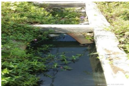
Gambar 3. Sampah di Saluran Drainase

Berdasarkan data di atas, dari segi sarana dan prasarana kota sungai penuh memiliki fasilitas yang cukup lengkap, akan tetapi sampai saat ini Kota Sungai Penuh belum memiliki lokasi pengolahan sampah yang defentif hal ini disebabkan karena tingginya penolakan masyarakat terhadap lokasi pengolahan akhir sampah. Terbatasnya cakupan pelayan persampahan di wilayah Kecamatan Hampan Rawang membuat sebagian masyarakat masih melakukan pengolahan sampah sendiri seperti membuang sampah ke sungai atau dengan cara membakar dan menimbun. Hal ini tentunya dapat menyebabkan gangguan pada saluran drainase tersebut seperti mengalami pengendapan dan penyumbatan oleh sampah dengan kondisi saluran yang seperti itu dapat menimbulkan genangan/banjir di sekitar wilayah tersebut. Gambar terkait keberadaan sampah di saluran drainase.