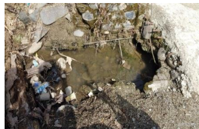
Gambar 2. Kondisi Saluran Drainase

Selain itu, terdapat juga kondisi saluran drainase yang terputus ditengah aliran hal ini menyebabkan jaringan drainase tidak terkoneksi antara satu dan yang lainnya. Permasalahan lainya juga ialah terdapat saluran drainase yang sudah rusak dan mengalami endapan pada dasar saluran drainase sehingga hal ini dapat mengganggu keberfungsian dari saluran drainase tersebut. Gambar 2 memperlihatkan kondisi drainase di Kecamatan Kota Sungai Penuh.