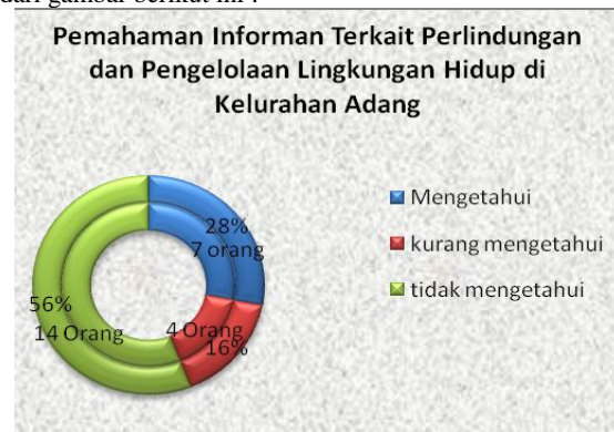
Gambar 1.2 Presentase pemahaman informan terkait upaya perlindungan dan pengelolaan lingkungan hidup di kelurahan Adang

Pemahaman masyarakat tentang perlindungan dan pengelolaan lingkungan hidup di kelurahan Adang dari hasil penelitian manunjukkan bahawa sebagian besar informan belum mengetahui betul hakekat tentang perlindungan dan pengelolaan lingkungan hidup. Untuk jelasnya dapat dilihat dari gambar berikut ini :