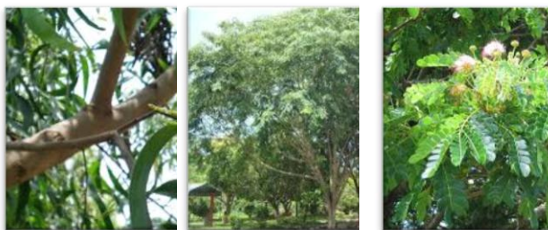
Gambar 2. (A) Akasia ( Acacia mangium ), (B) Angkana ( Pterocarpus indicus ), dan (C) Kihujan ( Samanea saman )

Pohon yang dapat menyerap polusi dengan baik memiliki beberapa kriteria diantaranya harus mempunyai tingkat kepadatan tajuk yang padat, terdiri dari kombinasi semak, perdu, dan tanaman penutup tanah dan memiliki jumlah daun yang banyak. Menurut Nasrullah (2001), untuk mengurangi jumlah polutan yang telah terlepas pada lingkungan dapat dikurangi dengan adanya vegetasi. Salah satu mekanisme tanaman dalam mereduksi polusi udara yaitu dengan proses difusi yaitu pemencaran polutan ke atmosfer yang lebih luas dengan menggunakan tajuk pohon. Ketika tajuk pohon memiliki ketinggian yang cukup, maka tajuk pohon dapat membelokkan hembusan angin ke atmosfer yang lebih luas, sehingga konsentrasi polutan dapat menurun. Selain itu, daun yang mempunyai jumlah banyak serta kombinasi antara semak, perdu, dan tanaman