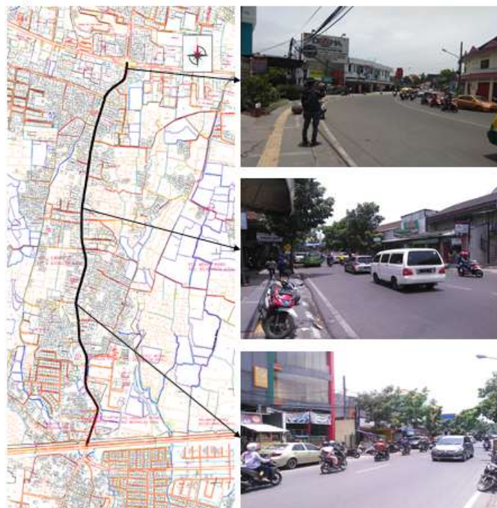
Gambar 3. Jalur (Path), Cibaduyut.