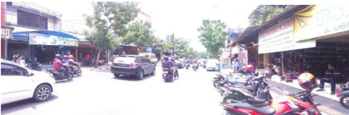
Gambar 7. Lingkungan koridor jalan Cibaduyut raya

Kawasan cibaduyut merupakan salah satu sektor industri pengrajin sepatu kulit dan wisata belanja terbesar di kota Bandung. Sektor industri kreatif sepatu kulit, Cibaduyut juga menjadi sektor pendukung pendapatan perekonomian kota Bandung. Mayoritas pengguna kawasan Cibaduyut merupakan masyarakat asli cibaduyut, dan rata-rata pedagang dan penguasa dan sebagian besarnya pengguna kawasan cibaduyut ini adalah pendatang dari kota-kota lain. Di sepanjang kawasan koridor jalan Cibaduyut raya ini berjejer ratusan toko menjajakan seputu kulit dan berbagai macam asesoris lainnya.