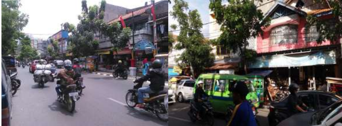
Gambar 8. Lingkungan koridor jalan cibaduyut raya

Kegiatan Kreativitas pengrajin sepatu kulit Cibaduyut dimulai sejak tahun 1920 sampai saat ini hingga memenuhi koridor jalan Cibaduyut di Kota Bandung dan menjadi kawasan wisata keratif pengrajin sepatu kulit. Masyarakat pada Kawasan Cibaduyut raya ini menjajakan hasil karya atau kreatifitasnya disepanjang jalan koridor Cibaduyut raya. Hal inilah yang membuat pertumbuhan pembangunan disepanjang koridor Cibaduyut raya berahlih fungsi yang dulunya hunian menjadi bangunan komersial.