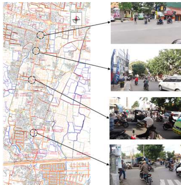
Gambar 5. Simpul (Node), Cibaduyut.