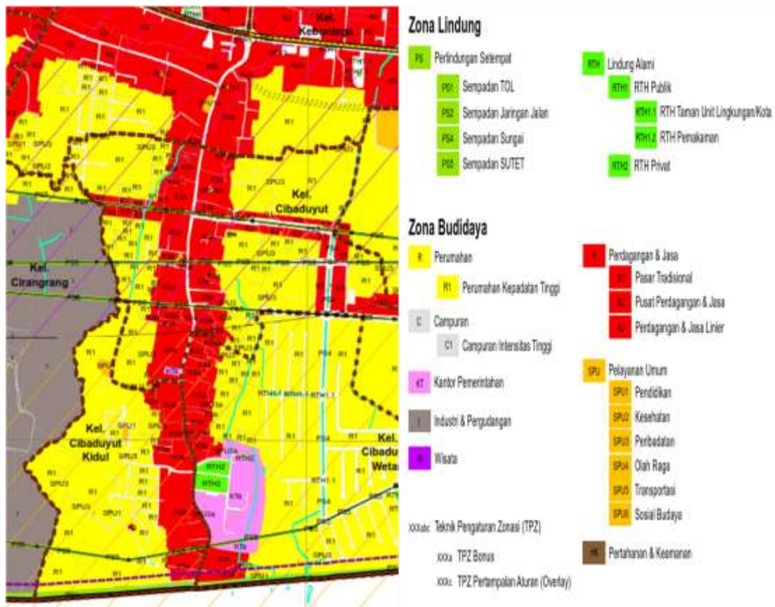
Gambar 1. Peta Cibaduyut Kota Bandung