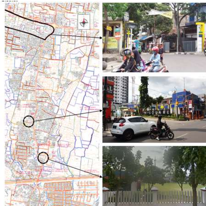
Gambar 4. Kawasan (District), Cibaduyut.