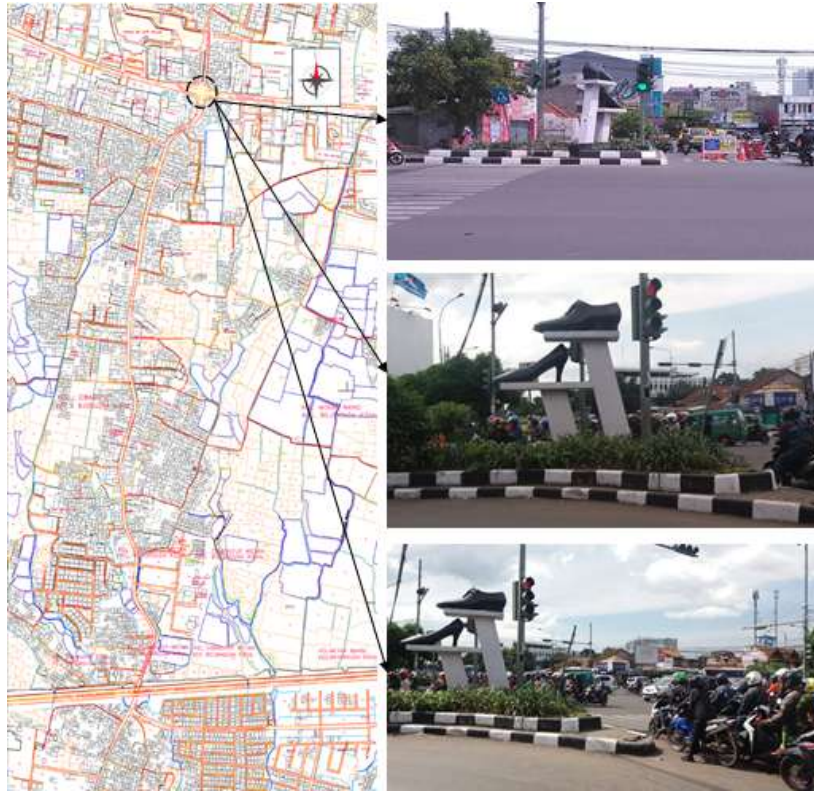
Gambar 2. Tetenger (Landmark) Cibaduyut.