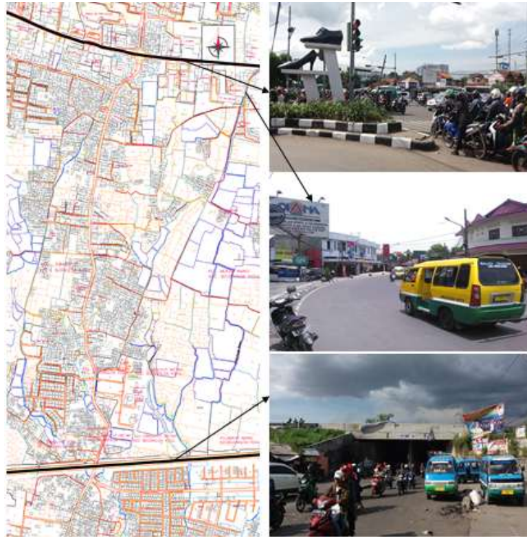
Gambar 6. Batas atau tepian ( Edge ), Cibaduyut.

Edge yang membatasi koridor Jalan Raya Cibaduyut berupa 2 Jalan Nasional, yaitu :Jalan Soekarno Hatta dan Jalan (Jembatan) Tol Purbaleunyi (Purwakarta, Bandung, Cileunyi).