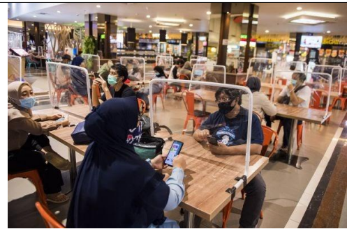
Gambar 13. Penerapan Protokol Kesehatan di Area Foodcourt

Penataan layout furniture pada area retail perlu memperhatikan jarak dan sirkulasi agar alur pengunjung di dalam ruang terarah dan pengunjung dapat menerapkan physical distancing dengan baik. Jarak antar furniture harus memperhatikan aturan protokol kesehatan sehingga memungkinkan pengunjung untuk mengambil jarak 1m dari pengunjung lainnya. Menerapkan sistem antrian sebelum memasuki area retail dan memisahkan jalur masuk dan keluar pada area retail dapat dilakukan untuk menerapkan protokol kesehatan.