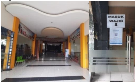
Gambar 7. Area Entrance Plaza Pragolo Setelah Pandemi