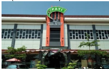
Gambar 1. Area Entrance Plaza Pragolo Sebelum Pandemi