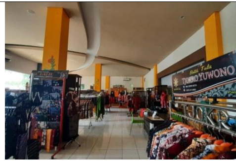
Gambar 8. Area Retail Plaza Pragolo Setelah Pandemi