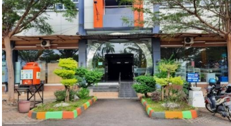
Gambar 6. Area Entrance Plaza Pragolo Setelah Pandemi