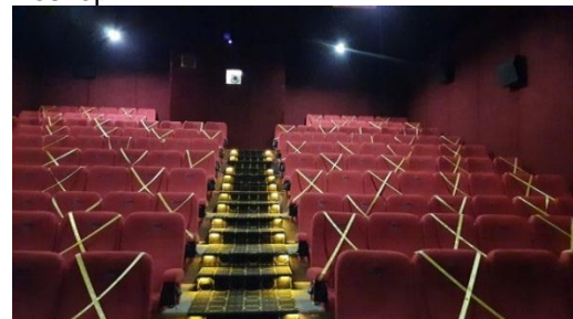
Gambar 10. Area Bioskop Plaza Pragolo Setelah Pandemi