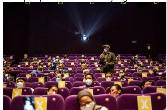
Gambar 14. Penerapan Protokol Kesehatan di Area Foodcourt

Pemilihan jenis dan penataan layout furniture pada area foodcourt akan berpengaruh untuk penerapan physical distancing demi menunjang protokol kesehatan. Hal ini dapat dilakukan dengan menggunakan furniture dengan kapasitas 2 orang agar tidak terjadi kerumunan, memberi jarak 1 m antar meja, serta menambah sekat pembatas pada meja makan. Area foodcourt cukup riskan terjadi penularan, karena saat makan atau minum pengunjung akan melepas masker. Maka dari itu, diperlukan penerapan protokol kesehatan yang baik.