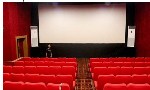
Gambar 5. Area Bioskop Plaza Pragolo Sebelum Pandemi