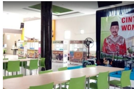
Gambar 4. Area Foodcourt Plaza Pragolo Sebelum Pandemi