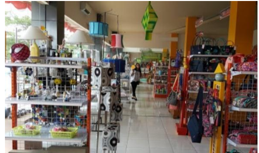
Gambar 3. Area Retail Plaza Pragolo Sebelum Pandemi