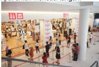
Gambar 12. Penerapan Protokol Kesehatan di Area Retail

Sebelum memasuki ruangan, pengunjung diwajibkan untuk mencuci tangan atau memakai hand sanitizer, melakukan pengecekan suhu badan, dan scanning barcode pada aplikasi PeduliLindungi, serta ada petugas yang berjaga. Oleh karena itu, diperlukan adanya penambahan fasilitas penunjang seperti alat pengecekan suhu dan tempat untuk mencuci tangan.