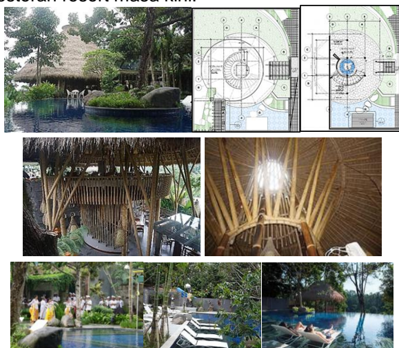
Gambar 1. Arsitektur Restoran Aruna

Eksistensi restoran Aruna sebagai berikut: Sosoknya terbuka ke alam-taman sekeliling, beratap kerucut dari alang-alang dan puncaknya sky-light datar (Gambar 2-atas). Material bangunan sebagian besar dari bambu: railing keliling lantai, tiang-tiang, balok ring, rangka atap. Terungkap bahwa karakter bangunan (keterbukaan, material lokal, atap bersusun) mirip dengan karakter Bale Wantilan tradisi Budaya Bali, namun bentuk ruangnya lingkaran. Lantai bawah bentuk lingkaran, pusatnya kolam ikan dan delapan buah kolom sekelilingnya (beton bertulang) searah dengan delapan mata angin. Tamu disambut pelayan restoran berpakaian adat Bali dengan tegur sapa Budaya Bali, lalu menikmati hidangan dalam suasana santai-segar sambil menikmati alam sekitar (kolam-taman-hutan, suara air-burung). Sesekali tamu mendengar-melihat gamelan-tari Budaya Bali (di pelataran sisi Baratnya) atau mengamati ritual ibadah/persembahan di Pura resort (Gambar 2-bawah). Sementara itu canang sari - hio bakar telah ada di tempatnya (entrance, tangga, kolam ikan). Sistem sosial Budaya Bali (keramahan, pakaian, ritual spiritual) tetap dijalankan dalam restoran resort masa kini.