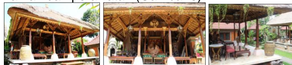
Gambar 5. Bale Gede Palebahan Rangki

Bale Gede posisinya di sisi Timur (disakralkan), lantai dari granit putih dengan level tertinggi di palebahan Rangki. Arsitektur Tradisional Bali ini beratap persisai dari alang-alang, tiang-balok kayu berukiran dibagian atas, terbuka ke muka-kiri-kanan, dinding bata di sisi belakang. Bangunan bertahan sejak dibangun kembali setelah runtuh total akibat gempa bumi tahun 1917, dengan sedikit penyesuaian terhadap tuntutan zaman dan perawatan (Gambar 5).