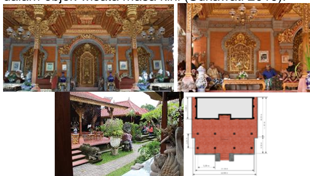
Gambar 4. Teras Muka Bale Ukiran

4) Makna keharmonisan-keselarasan alam setempat, ditafsir dari keterbukaan teras ke lingkungan sekitar, tiang-balok dari kayu alam setempat, dinding pasangan bata dari sumber setempat, pekerja/pengukir dari masyarakat setempat. 5) Makna Harmoni Kehidupan masa lalu-masa kini (istana menjadi objek wisata) melalui proses adaptasi, ditafsir dari atap genting berornamen (dulu alang-alang), ukiran warna emas (dulu polos), teras bertingkat lantai granit merah. Ukiran warna emas dan lantai granit merah adalah wujud pelestarian Kemegahan istana masa lalu yang dalam objek wisata masa kini (Sukawati 2019).