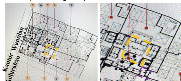
Gambar 1. Puri Saren Agung Ubud.

Palebahan Rangki di dalam tatanan Puri Saren Agung Ubud memiliki nilai tengah-tengah ( madyaning madya ) dan berfungsi sebagai area penerima tamu keluarga puri, sarana upacara, dan hunian anggota keluarga (Putri, 2016). Selain itu, juga berperan sebagai pusat area pelaksanaan kegiatan upacara keagamaan, pertemuan, dan acara ritual (pernikahan, satu/tiga bulanan bayi, kematian) di dalam Puri Saren Agung, dengan keterlibatan masyarakat dalam pekerjaan persiapan upacaranya (Widodo, Pramitasari & Marcillia, 2018). Palebahan Rangki meliputi 5 bale Loji (kamar tamu), bale Delod (panggung kesenian), bale Gede (tempat upacara ritual) dan bale Ukiran (penerima tamu, pertemuan, hunian keluarga) (Gambar 1). Bale Ukiran dan bale Gede dominan dalam aspek bentuk dan fungsinya, maka dipilih sebagai objek studi.