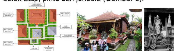
Gambar 3. Tata Masa Ruang Palebahan Rangki 2018, Bale Ukiran, Bale Ukiran Semula.

Bale Ukiran adalah bangunan utama dalam Palebahan Rangki, posisinya di bagian tengah, tampilannya formal, megah dan mewah, merepresentasikan istana. Gaya arsitekturnya Tradisional Bali, atap limasan genting tanah berornamen, dinding kamar/ruang keluarga dari bata merah halus, teras muka luas-terbuka-bertingkat dan lantai batu granit merah halus dengan level satu meter-an diatas halaman. Teras dipenuhi ukiran kayu warna emas pada plafon, bagian atas tiang-tiang, balok atap, pintu dan jendela (Gambar 3).