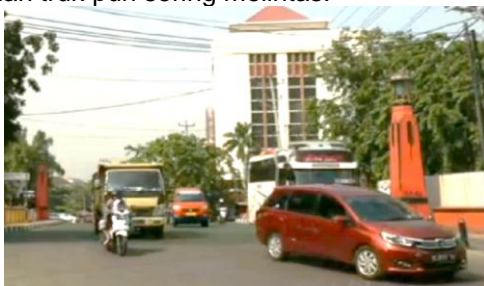
Gambar 7. Lalu Lintas Pada Jl Mpu Tantular

Hampir di seluruh ruas jalan utama di kawasan ini sangat ramai dilalui kendaraan, baik pada siang maupun malam hari. Jenis kendaraan besar seperti bus dan truk pun sering melintas.