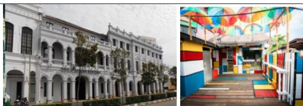
Gambar 2. Kawasan George Town, Malaysia

Setiap perubahan bangunan dibatasi di bawah hukum konservasi UNESCO. Setiap perubahan penggunaan, peninggian atau penambahan panjang bangunan, struktur atau penambahan bangunan baru harus seizin National Heritage Act dan tidak mengubah fasadnya. Beberapa warga disini membuat lukisan dinding dan hal tersebut ternyata dapat menarik wisatawan (Salim, 2018).