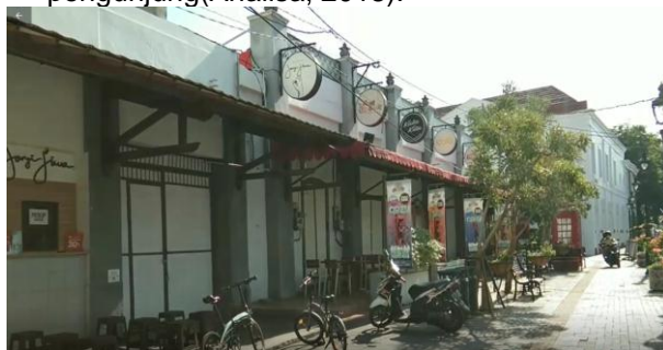
Gambar 5. Deretan Café Di Sepanjang Jalan Letjend Soeprapto