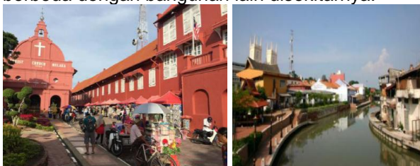
Gambar 1. Kawasan Melaka, Malaysia

kenyamanan bagi pejalan kaki. Selain itu juga ditambahkan papan informasi yang memuat penjelasan dan foto lama kawasan tersebut. Selain itu terdapat pendukung kegiatan yang beragam seperti ruang terbuka, toilet, kursi, hotel, café dan restoran. Pemerintah juga menyediakan bus dan becak wisata dengan bentuk yang atraktif untuk megitari kawasan inti. Pada kawasan ini juga terdapat bangunan yang menjadi landmark kawasan seperti Red Square/ Komplek Stadthuys dimana seluruh bangunan di area ini dicat merah sebagai penanda bangunan yang dikonservasi. Menurut Lynch dalam Purwantiasning (2015), adanya bangunan yang menjadi landmark suatu kawasan dapat meningkatkan citra dan kualitas serta karakter kawasan tersebut, karena memiliki visual yang strategis dan keunikan pada bentuknya yang berbeda dengan bangunan lain disekitarnya.