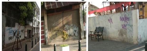
Gambar 12. Vandalisme di Kawasan Kota Semarang Perbedaan Fasad Bangunan

Meskipun sudah banyak berkurang, namun nyatanya masih terdapat vandalisme pada dinding maupun bagian bangunan lain seperti pintu di beberapa bagian kawasan ini. Hal ini dapat ditemukan antara lain di Jl Letjend Soeprato dan Jl Kepodang. Hal ini merusak estetika kawasan dan dapat merusak bangunan cagar budaya.