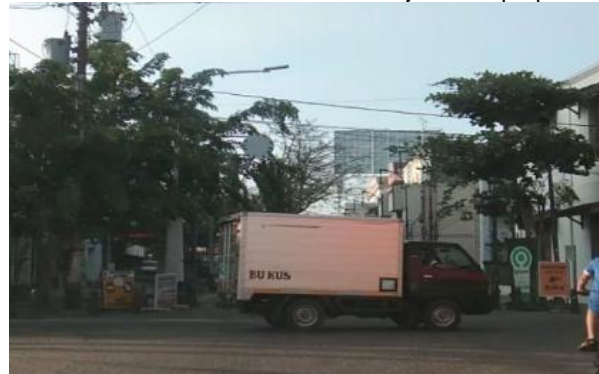
Gambar 9. Lalu Lintas Pada Jl Cendrawasih

Setelah direvitalisasi, kawasan ini semakin dikenal dan dikunjungi lebih banyak orang, sehingga volume kendaraan yang lewat pun semakin banyak, apalagi saat akhir pekan. Kepadatan lalu lintas terutama terjadi di Jalan Letjend Suprpto, karena selain dilintasi kendaraan yang akan menuju ke Kawasan Kota Lama, juga dilalui kendaraan yang melintas kearah lain, karena merupakan salah satu jalur yang terhubung dengan pusat kota (Kusumaningtyas dan Kurniati, 2018). Aktivitas kendaraan tersebut tidak sesuai dengan kapasitas lingkungan dan berpotensi meningkatkan polusi, yang mengurangi kenyamanan pengunjung. Pengurangan emisi juga menjadi salah satu isu yang harus diperhatikan (Prabowo dan Salaj, 2020).