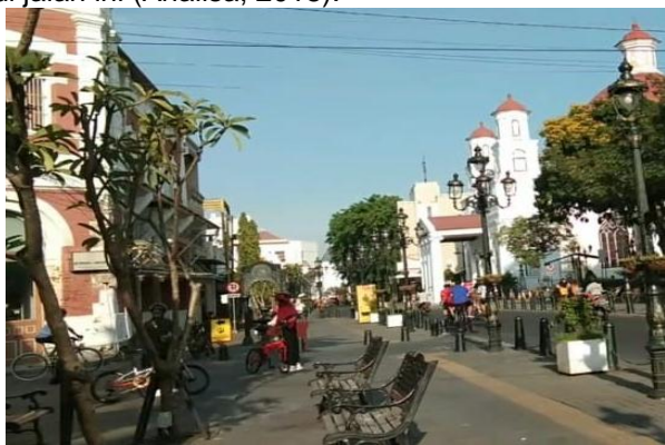
Gambar 4. Keramaian di Sepanjang Jl Letjend Soeprapto

Keramaian hanya terpusat di satu lokasi, yaitu di sepanjang Jalan Letjend Soeprapto yang merupakan jalan utama, walaupun titik-titik lain pun juga dikunjungi masyarakat, namun tidak seramai di sepanjang jalan ini. Sebagian besar kegiatan terjadi di jalan ini (Analisa, 2018).