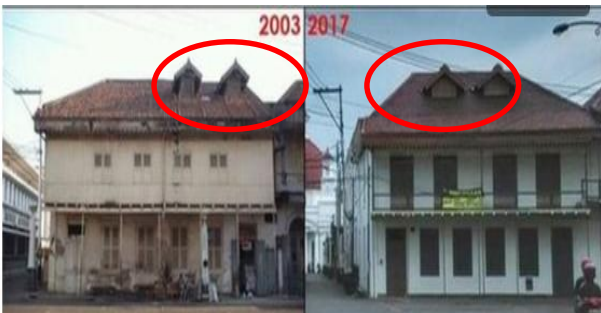
Gambar 14. Fasad Depan RM Pringsewu Sebelum dan Sesudah Dikonservasi

Namun, ditahun 2016 telah dilakukan konservasi, sehingga kondisi bangunan sekarang tampak terpelihara dengan baik. Namun terjadi perubahan pada fasad depan bangunan, terutama atapnya.