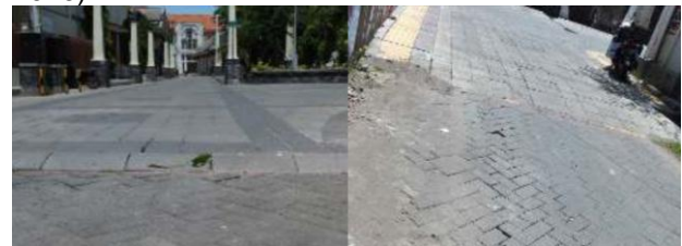
Gambar 10. Kondisi Paving di Jl Garuda dan Jl Branjangan

Sebagai upaya revitalisasi untuk mengatasi meningkatnya volume kendaraan di kawasan ini, maka dilakukan perbaikan kondisi jaringan jalan di seluruh kawasan, pelebaran pedestrian serta penambahan street furniture seperti pembatas jalan untuk meningkatkan kenyamanan dan keamanan pejalan kaki diantara banyaknya kendaraan yang melintas. Selain itu beberapa lajur jalan ada yang berubah menjadi satu arah, agar tidak menyebabkan kemacetan atau penumpukan kendaraan pada suatu lokasi (Firdausyah dan Dewi, 2020). Sebelum direvitalisasi, jalan di kawasan ini memang telah menggunakan paving blok (Firdausyah dan Dewi, 2020).