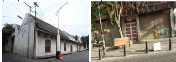
Gambar 11. Bangunan Kosong di Kawasan Kota Lama Semarang

Setelah dilakukan revitalisasi, banyak bangunan yang difungsikan untuk bangunan komersial (Firdausyah dan Dewi, 2020). Akan tetapi, masih terdapat juga bangunan yang tidak dimanfaatkan. Bangunan kosong tersebut menjadi tidak terawat, rusak, memberikan kesan kumuh dan menyeramkan. Suasana kawasan pun menjadi sepi karena tidak ada kegiatan didalamnya. Hal ini terjadi karena beberapa bangunan belum diketahui pemiliknya dan klaim lahan yang sulit dilakukan karena sertifikatnya merupakan warisan turun temurun, sehingga Pemkot sulit mengambil langkah untuk mengkonservasi bangunan tersebut. Bangunan yang dimiliki oleh swasta/perorangan tidak dilakukan pemeliharaan dan pengelolaan yang sesuai karena mahal biaya dan sulitnya prosedur konservasi. Beberapa bangunan dibiarkan begitu saja oleh pemiliknya, hingga roboh dengan sendirinya dan dapat dibangun bangunan baru pada lahan tersebut. Ada juga yang meminta dicabut status cagar budayanya, karena takut sulit jika akan dijual (Sari et al, 2017). Ada juga beberapa bangunan yang hanya dibiarkan saja oleh pemiliknya sehingga dindingnya ditumbuhi tanaman liar (Puspitasari dan Ramli, 2018).