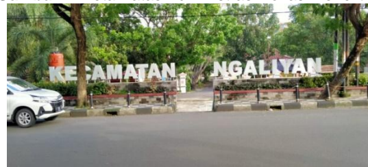
Gambar 2. Taman Kecamatan Ngaliyan

Taman Kecamatan Ngaliyan dikelilingi oleh beberapa aktivitas perkantoran serta perdagangan dan jasa. Dapat dikatakan bahwa Taman Kecamatan Ngaliyan berada ditengah-tengah aktivitas masyarakat. Lokasi Taman Kecamatan Ngaliyan yang berada dibawah jalan utama Prof. Dr. Hamka mengakibatkan tidak dapat terlihat secara langsung, karena kontur tanah yang ada sehingga posisi Taman Kecamatan Ngaliyan berada dibawah dari jalan Prof. Dr. Hamka. Untuk mencapai lokasi pengunjung dapat melewati sisi sebelah timur dan selatan. Taman Kecamatan Ngaliyan bersebelahan dengan pasar Ngaliyan tentunya akan dilewati setiap harinya oleh orang-orang yang akan menuju ke pasar Ngaliyan.