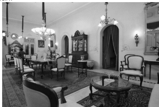
Gambar 10. Ruang Gadri setelah konservasi

Ruangan Gadri terletak di belakang Dalem Ageng saat ini dilengkapai dengan seperangkat furniture bergaya antik. Furniture tersebut merupakan koleksi pribadi H. Santosa Doellah. Pada bidang dinding juga dilengkapi dengan cermin dan juga beberapa foto. Sedangkan pada ceiling dipasang beberapa lampu gantung. Desain lampu gantung tersebut merupakan pengembangan dari lampu gantung aslinya. Selain lampu gantung, pada dinding juga dipasang wall lamp . Untuk lorong pintu yang menghubungkan ruangan Dalem Ageng dengan Gadri dilengkapi dengan kain gorden berwarna merah. Dinding dicat warna krem ( broken white ) dan dilengkapi profil seperti pada ruangan Pringgitan. Lantai memakai material keramik pada bagian tengah diberi border ornamen geometris berwarna abu-abu serta dilengkapi karpet. Dan bagian belakang adalah area teras belakang ( emper ) yang memiliki tampilan representatif dilengkapi dengan taman.