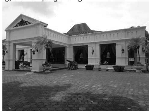
Gambar 6. Fasad bangunan setelah konservasi

Bangunan Dalem Wuryaningratan dilakukan konservasi setelah berganti kepemilikannya. Oleh pemilik kedua (H. Santosa Doellah) dilaksanakan konservasi pada tahun 1999. Dan bangunan tersebut juga sudah ditetapkan sebagai bangunan cagar budaya melalui SK Walikota no: 646/116/1/1997. Secara fisik bangunan tidak banyak mengalami perubahan. Namun ada penggunaan material bangunan yang baru. Bagian halaman depan ( latar ) ditata sehingga terlihat lebih rapi dan asri. Patung manusia dan buaya tetap dipertahankan hal ini berfungsi sebagai penanda tahun berdirinya bangunan tersebut sebagai Candrasengkala. Beberapa penambahan asesoris di depan bangunan, seperti: meriam, pot tanaman, dan lampu dinding, dan lampu gantung.