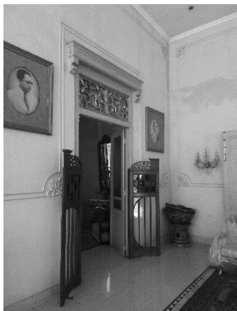
Gambar 8. Sudut ruangan Seketheng dengan Pringgitan

Pada bagian dinding ruangan Pringgitan dan Seketheng dicat warna broken white dan pada bidangnya diberi ornamen profil. Sebelum dikonservasi ornamen profil tersebut hanya berupa gambar dibuat dengan teknik cat. Namun setelah konservasi dibuat lebih berdimensi karena memiliki ketebalan. Elemen pintu masih memakai pintu asli hanya difinishing ulang, dan pada ornamen bagian atas pintu diwarnai emas ( prada ) sehingga terlihat lebih mewah.