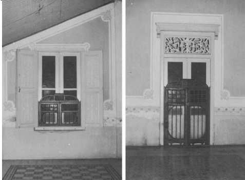
Gambar 3. Jendela dan pintu pada ruangan Seketheng

finishing cat warna krem/kuning gading. Pada bagian atas pintu juga dipasang cornice kayu finishing cat warna krem. Bagian bawah cornice kayu terdapat lobang angin dengan motif ukiran ornamen flora .