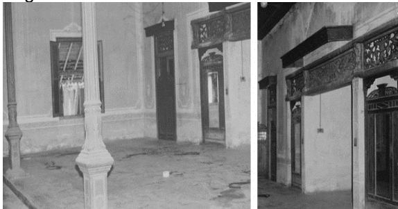
Gambar 4. Dalem Ageng dengan pintu kaca benggala yang menghubungkan dengan ruangan Gadri

Ruangan Dalem Ageng terdapat Senthong kanan, Senthong kiri, dan Senthong tengah (Krobongan) karena berada di bagian tengah. Senthong tengah sering disebut Krobongan dimana bagian tengah ini dianggap sakral (Widayat, 2004:2). Dalem Ageng ber dinding batu bata dan juga terdapat dua buah saka berbentuk Composite (bentuk seperti pada pendapa). Pada dinding sebelah kanan-kiri terdapat pintu yang menuju pada teras samping kanan-kiri Dalem Ageng. Sedangkan diantara Senthong tengah dengan Senthong yang berada di kanan-kirinya dipisahkan dengan lorong yang menuju ke ruangan Gadri (ruangan untuk makan dan minum). Pada bagian lorong dibuatkan pintu dengan bentuk seperti pada pintu luar ruangan Seketheng maupun Senthong kanan-kiri, namun diberi kelengkapan pada bagian tengah yakni cermin (kaca benggala). Kaca benggala merupakan salah satu kelengkapan (barang kagunan ) pada ruangan Dalem Ageng. Umumnya beberapa barang kagunan yang disimpan di ruangan Dalem Ageng antaralain: ranjang, patung loro-blonyo, songsong, tombak, watang, jagrag, gambar, kaca benggala, dan lampu robyong (Widayat, 2016:5). Khusus kaca benggala pada Dalem Wuryaningratan tidak dipasang menempel pada dinding, namun dipasang ( inlay ) pada pintu lorong yang menghubungkan Dalem Ageng dengan ruangan Gadri.