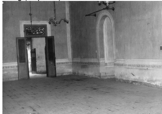
Gambar 5. Ruang Gadri.

Ruangan Gadri merupakan tempat makan dan minum yang terletak di belakang Dalem Ageng. Gadri dihubungkan oleh dua lorong yang berada di sebelah kanan-kiri Senthong tengah/Krobongan. Kondisi Gadri kosong tanpa furniture , hanya beberapa lampu gantung yang masih terpasang. Sedangkan di atas pintu lorong terdapat gantungan ( hanging rel ) gordena. Lantai memakai material tegel bermotif, sedangkan dinding bata dicat dengan dominasi warna kuning dan dibuat border mirip warna cat pada dinding Dalem Ageng. Dan pada bagian paling belakang bangunan yakni teras belakang ( emperan ).