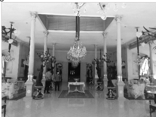
Gambar 7. Kondisi Pendapa Dalem Wuryaningratan

suluran pada bagian atap Kuncung (pedimen) masih dipertahankan namun pada bagian tengah dibuat huruf 'DH' sebagai inisial pemilik sekarang. Sedangkan rentang antar balok bata pada bagian teras ( emper ) dipasang kaca. Juga elemen interior tambahan berupa kain gorden berwarna kuning. Hal ini dilakukan dengan pertimbangan mencegah masuknya debu serta untuk faktor keamanan. Faktor keamanan sangat diperhatikan terkait keberadaan beberapa barang-barang koleksi pribadi yang dihadirkan sebagai elemen pengisi ruangan Pendapa, seperti: furniture , patung gaya Eropa, lampu kristal, pot keramik, karpet dan guci keramik. Lantai Pendapa diganti keramik 40 cm x 40 cm warna putih dan border ornamen. Pada langit-langit memakai material gypsumboard sehingga terlihat lebih rapi. Sedangkan tiang Pendapa difinishing ulang, warna prada (emas) pada bagian ornamen kepala tiang (mahkota), dan bagian bawah badan tiang (ornamen flora ), antara badan dengan umpak (bagian kaki). Secara keseluruhan tiang dicat dengan warna broken white .