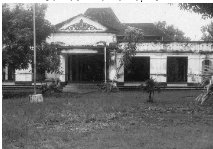
Gambar 2. Tampak Depan Dalem Wuryaningratan.

Pengaruh budaya Eropa secara visual terlihat pada teras (Kuncung) dan ruangan Pendapa (ruangan bagian depan). Pada bagian atap Kuncung berbentuk gevel seperti umumnya terdapat pada bangunan kolonial dan ditopang pilar balok bata pada sisi kanan-kiri. Bagian pedimen terdapat ornamentik berupa motif sulur-suluran. Sedangkan bagian entablature polos tanpa ornamen hanya profil pada bagian pinggir. Bangunan Pendapa berbeda dengan pendapa pada bangunan dalem pada umumnya yang lebih terbuka. Sedangkan pendapa