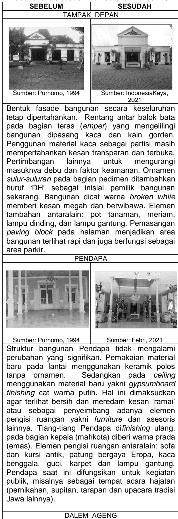
Tabel analisis sebelum dan sesudah konservasi

Dari data lapangan dapat dianalisis melalui tabel berikut ini: