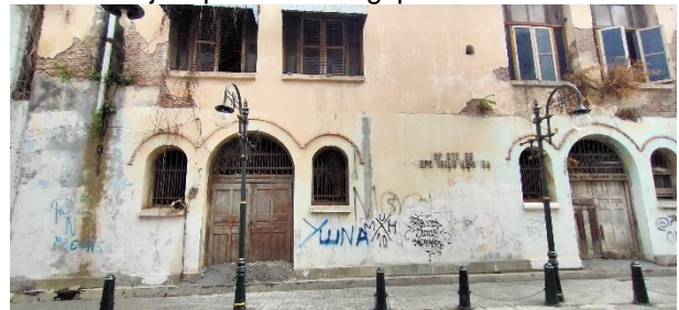
Gambar 6. Vandalisme di salah satu bangunan di jalan Merpati Semarang

Salah satu permasalahan klasik yang sampai saat ini mesih menjadi penyakit masyarakat saat ini adalah vandalisme. Walaupun sudah ada upaya menghilangkan, namun vandalisme ini tetap saja terjadi di beberapa lokasi. Hal ini yang kedepanya harus menjadi perhatian bagi pemerintah