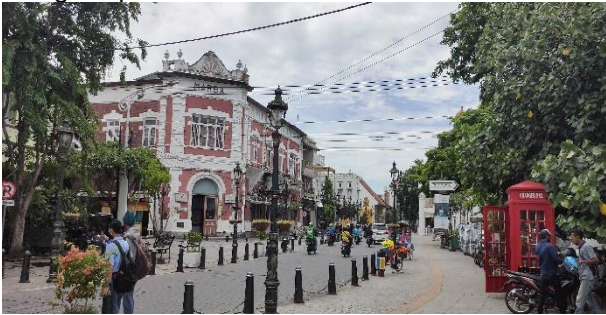
Gambar 1. Hasil Revitalisasi tahap 1 kota lama Semarang

makan, coffee shop , sehingga semakin mengakomodasi wisatawan untuk lebih menikmati berwisata di kawasan kota lama Semarang ini serta menghidupkan kembali ekonomi di kawasan tersebut.