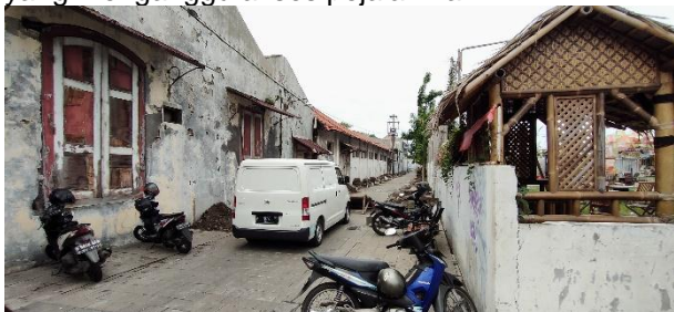
Gambar 10. Parkir liar di jalan kedasih, Semarang (dokumentasi pribadi, 2020)

Sedangkan di Indonesia bila mana konsep ini diterapkan maka diperlukan tempat parkir yang cukup banyak. Dikarenakan kebiasaan masyarakat Indonesia yang memiliki kecenderungan menggunakan kendaraan pribadi dari pada umum. Hal ini nyata terjadi pada kota lama Semarang pada tahun 2020 ini. Akibatnya banyak terjadi parkir liar yang mengganggu akses pejalan kaki.