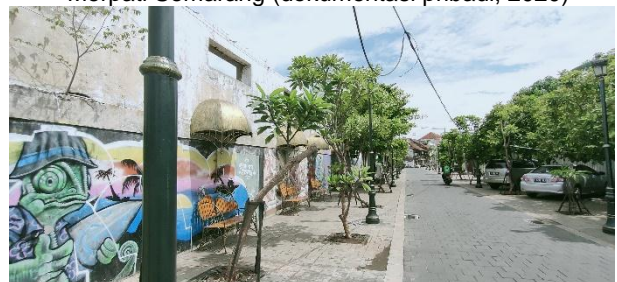
Gambar 7. Vandalisme di salah satu dinding bangunan di jalan Nuri Semarang (dokumentasi pribadi, 2020)

Namun ada pula vandalis yang disengaja dan diindikasikan merupakan salah satu sub-pekerjaan dari revitalisasi seperti yang terjadi di salah satu dinding bangunan di jalan Nuri.