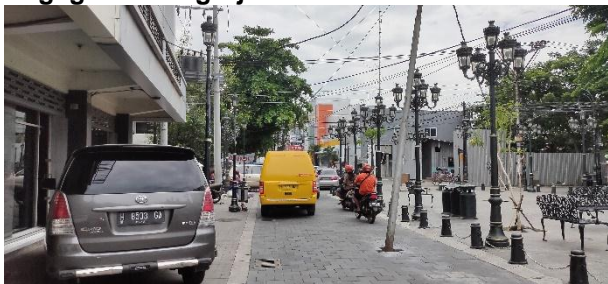
Gambar 18. Tiang listrik di tengah jalan Kepodang, Semarang (dokumentasi pribadi, 2020)

Terdapat sebuah tiang listrik yang berada di tengah jalan raya yang mengakibatkan tidak lancarnya lalu lintas transportasi.