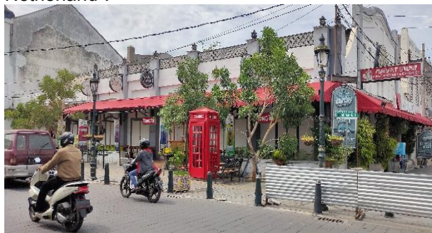
Gambar 13. Charger box yang mirip telephone box ala London, Inggris

Hal yang sangat disayangkan adalah munculnya beberapa detail street furniture yang terkesan dipaksakan karena tidak sesuai konsep "Little Netherland".