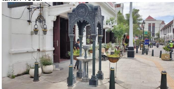
Gambar 15. Drinking fountain ala era victorian, Inggris