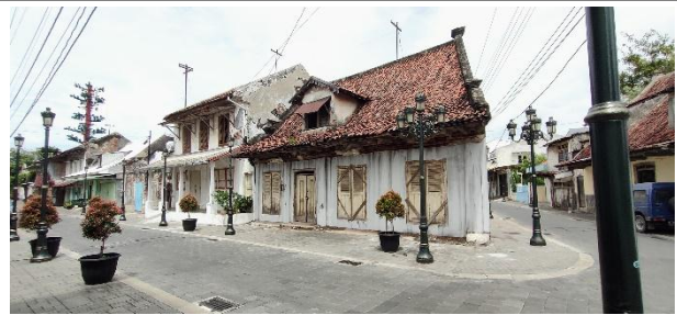
Gambar 5. Rumah yang tidak di Revitalisasi di jalan Kedasih Semarang