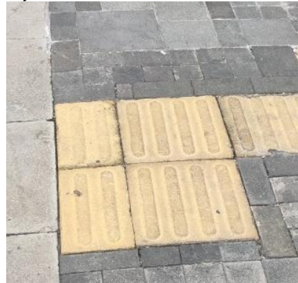
Gambar 19. Kegagalan Guiding block, jalan Nuri, Semarang (dokumentasi pribadi, 2020)

Ada guiding block yang akan membingungkan untuk Disabilitas, bahkan cenderung dapat membahayakan.