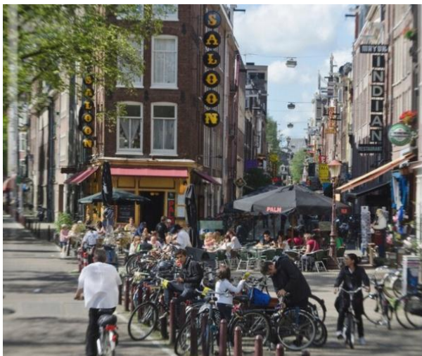
Gambar 9. Old town, Amsterdam

Salah satu akibat lain dari konsep mempersempit jalan raya dan melebarkan jalan pejalan kaki dalam Revitalisasi kota lama Semarang ini. Adalah terbatasnya lahan parkir. Konsep Revitalisasi kota lama Semarang, memang mengusung konsep town walk layaknya pada masa lalunya dan juga seperti pada old town di Amsterdam, Belanda. Hal ini juga didukung di sediaknya sepeda untuk umum sebagai transportasi di daerah kawasan kota lama ini.