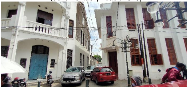
Gambar 11. Parkir liar di gang antara gedung di jalan kepodang, Semarang (dokumentasi pribadi, 2020)

Akibat dari parkir liar tersebut dinas perhubungan kota Semarang kerap memberikan peringatan berupa penertiban. Hal ini kedepannya perlu diperhatikan untuk revitalisasi tahap berikutnya.