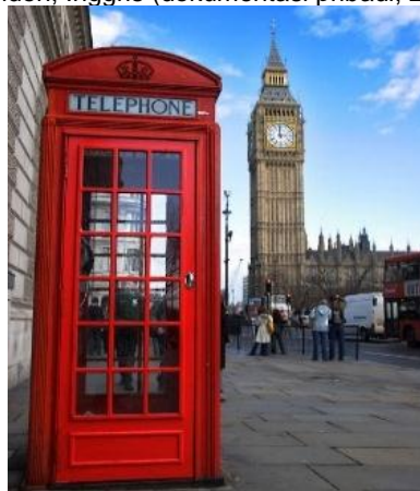
Gambar 14. telephone Box London, Inggris Telephone box merah ini menjadi ciri khas kota London di Inggris. Hal ini tentu bersimpangan dengan Belanda, karena sejarahnya kedua negara tersebut dalam kubu yang berbeda. Sedangkan telephone sendiri baru masuk di Indonesia pada tahun 1882.