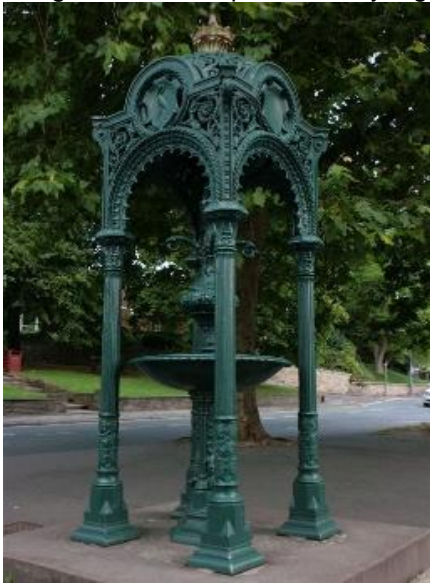
Gambar 16. Drinking fountain di Bristol, Inggris

Drinking fountain ini menjadi cirikhas era Victorian (1837-1901). Ditinjau dari masanya cukup jauh dari era VOC yang lebih identik dengan kota lama Semarang. Selain itu masa Raffles juga terjadi sebelum era Victoria. Dan tidak berpengaruh sampai ke Semarang karena masa pemerintah yang singkat.