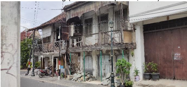
Gambar 3. Rumah yang tidak di Revitalisasi di jalan Kedasih Semarang