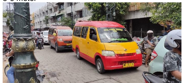
Gambar 8. Kemacetan yang terjadi jalan Sendowo Semarang

Akibat dari konsep mempersempit jalan raya dan melebarkan jalan pejalan kaki dalam Revitalisasi kota lama Semarang ini. Terdapat beberapa kemacetan yang terjadi di beberapa lokasi. Mengingat jalan utama yang dilalui lalu lalang oleh angkutan umum namun lebar jalanya hanya sekitar 5-6 meter