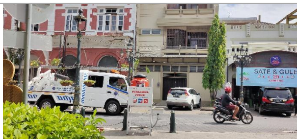
Gambar 12. Penertiban parkir liar oleh DISHUB kota Semarang di jalan Letjen Suprpto, Semarang

Akibat dari parkir liar tersebut dinas perhubungan kota Semarang kerap memberikan peringatan berupa penertiban. Hal ini kedepannya perlu diperhatikan untuk revitalisasi tahap berikutnya.