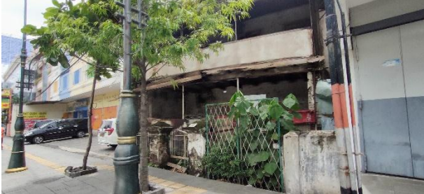
Gambar 2. Bangunan mangkrak di jalan Cendrawasih Semarang (dokumentasi pribadi, 2020)

Hal ini akan mejadi permasalahan ketika ketidakselarasan terjadi antara infrastruktur yang telah tertata bersih dan rapi berbanding terbalik dengan fasad bangunan yang belum mengalami revitalisasi yang tidak sesuai dengan konsep revitalisasi kawasan atau dapat dikatakan kumuh.