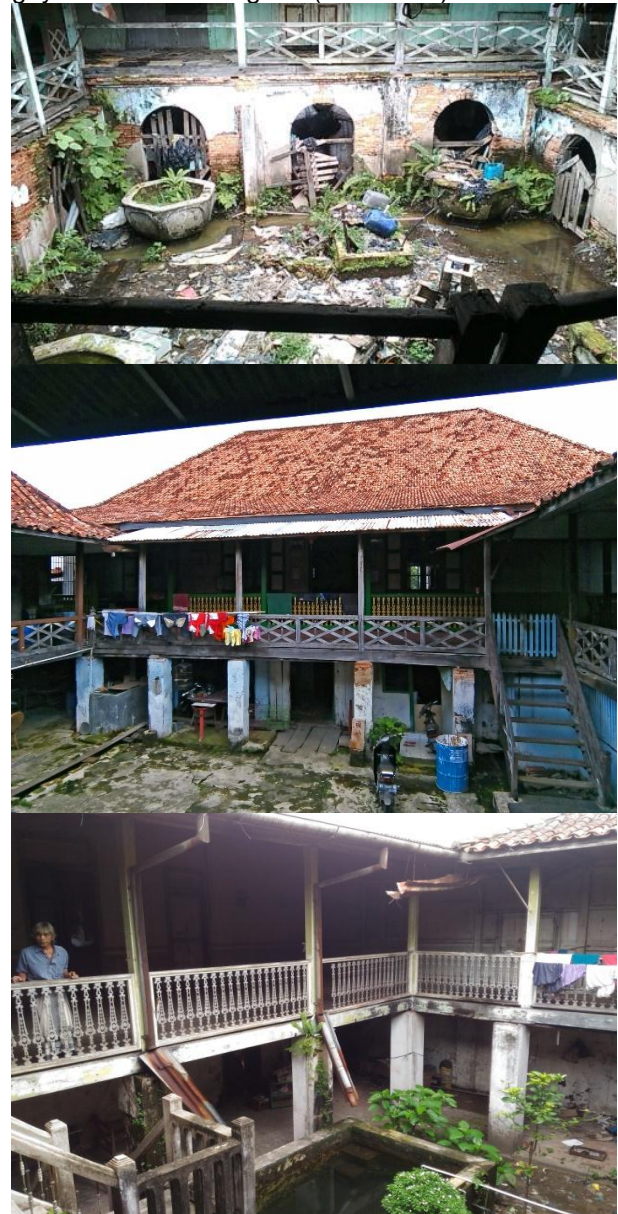
Gambar 7. Courtyard Rumah Abu (atas), Rumah Kapitan (tengah), dan Rumah Bapak Gempita (bawah)

Hal yang mencolok dari penataan ruang di ketiga rumah ini yaitu terdapatnya Courtyard di bagian tengah dalam rumah yang dimana identik dengan gaya arsitektur Tionghoa (Gambar 7).