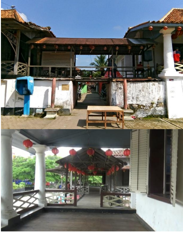
Gambar 8. Teras Rumah Abu dan Rumah Kapitan yang terhubung dengan jembatan kayu.

Seperti yang dapat dilihat di Gambar 6, ketiga rumah ini memiliki kesamaan pola tampak yang tersusun dari bagian bawah, badan, dan atap. Pola fasad ini mirip dengan tampak rumah tradisional limas Palembang yang dimana terdapat bagian bawah berupa panggung, badan rumah, dan atap. Bentuk atap yang digunakan juga seperti atap rumah limas akan walau cukup berbeda yang dimana tidak terdapatnya ornamen di bubungan atapnya. Puncak atapnya juga berada dekat di bagian depan bangunan sedangkan atap rumah tradisional limas lebih kebelakang yang biasanya berada di tengah.