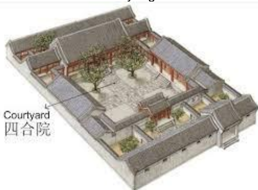
Gambar 2. Courtyard pada rumah cina

Courtyard merupakan ruang terbuka pada rumah tradisional Tionghoa. Ruang terbuka ini lebih bersifat privat. Biasanya termasuk sebagai taman/kebun. Rumah di daerah Cina Utara biasanya memiliki courtyard yang lebih luas disbanding dengan di daerah Cina Selatan karena lahan rumah yang tidak besar.