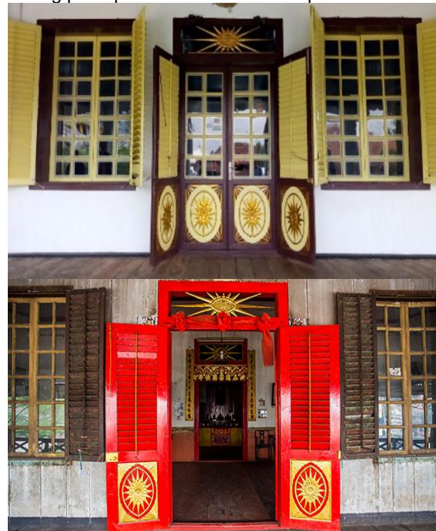
Gambar 9. Ornamen Pintu Utama pada Rumah Abu (atas) dan Rumah Kapitan (bawah).

Ornamen paling mencolok dapat dilihat di pintu utama pada Rumah Abu dan Rumah Kapitan. Kedua pintu ini hampir identik yang dimana memiliki empat buah daun pintu untuk bukaan keluar dan kedalam. Sama halnya dengan jedela di samping kanan dan kiri pintu utama yang dimana juga memiliki empat daun jendela sebagai bukaan keluar dan kedalam. Bukaan pintu dan jendela dua arah ini identik dengan gaya arsitektur kolonial. Akan tetapi ornamen pada kedua pintu utama mengandung elemen gaya arsitektur cina berupa ornament bentuk lambang matahari dan cat merah terang pada pintu utama Rumah Kapitan.