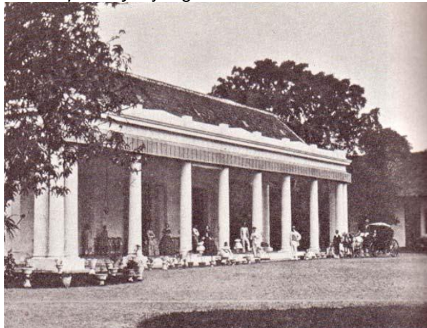
Gambar 1. Contoh rumah gaya arsitektur Indische Empire di Jakarta awal abad 18-19.

Kolonial Belanda di Indonesia. Gaya arsitektur ini, seperti namanya merupakan pencampuran antara kebudayaan Indische yang merupakan pencampuran budaya Eropa, Indonesia dan Cina dan Empire Style yang berasal dari Perancis.