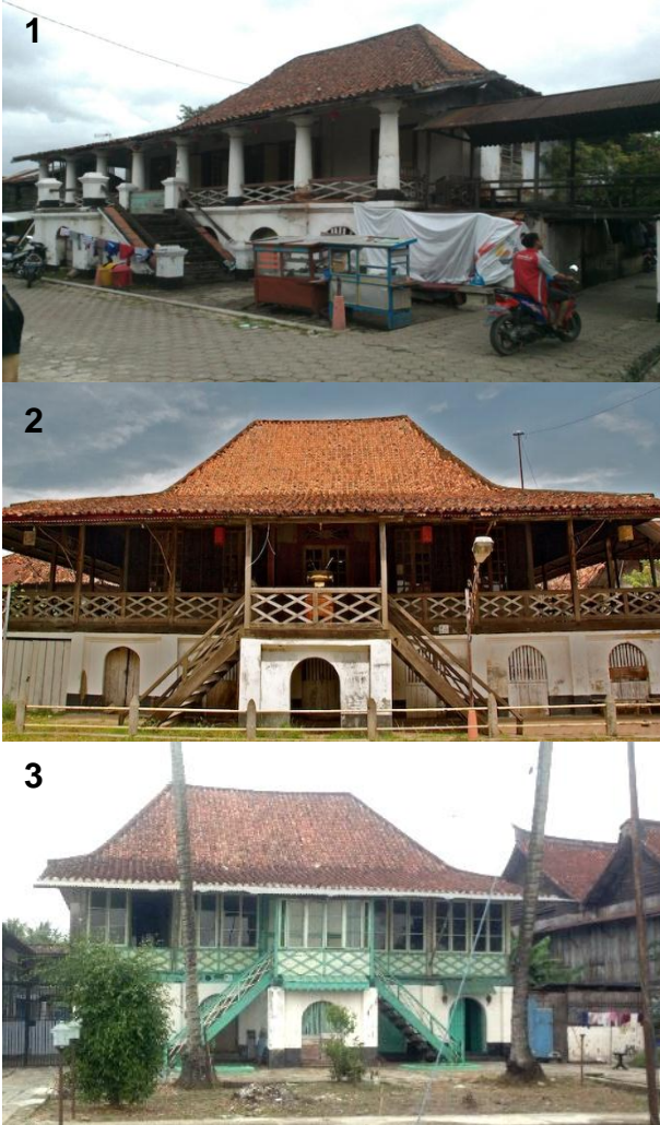
Gambar 6. Rumah 1 (Rumah Abu), Rumah 2 (Rumah Kapitan), dan Rumah 3 (Rumah Bapak Gempita)

Dalam penelitian ini akan diamati 3 rumah tradisional. Aspek yang diamati dari ketiga rumah ini adalah melihat elemen tata ruang, fasad, bahan bangunan, dan sistem konstruksi dan ornamennya. Rumah 1 adalah Rumah Abu ini yang dulunya memiliki fungsi sebagai rumah pengadilan dan penjara pada zamannya. Sekarang sudah dialihfungsikan sebagai rumah penyimpanan abu keluarga marga Tjoa. Pemerintah sebenarnya sudah melirik rumah ini untuk menawarkan pemugaran atau perbaikan terhadap elemen-elemen bangunan yang mulai rapuh namun penawaran yang ditawarkan oleh pemerintah belum sesuai. Rumah Abu ini pada bagian belakang bangunan sudah rapuh dan ambruk dikarenakan kurangnya perawatan. Rumah 2 adalah Rumah Kapitan yang dimana dulunya dijadikan tempat berkumpul keluarga inti dari kapitan yang kini dijadikan sebagai tempat tinggal keturunan kapitan hingga sekarang. Rumah 3 ini di gunakan oleh Tjia Kiam Boh (masih keluarga kapitan) yang kemudian dibeli oleh M. Hosein yang merupakan orang tua dari Bapak Gempita sekitar kurang lebih 58 tahun yang lalu. Sejak saat itu rumah ini tempati oleh Bapak Gempita bersama keluarganya. Pada bagian belakang dan lantai satu rumah ini telah disewakan kepada orang lain untuk dihuni.