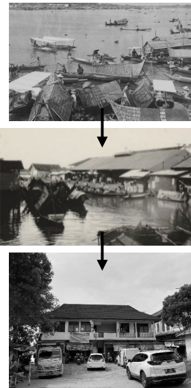
Gambar 2. Perkembangan Pasar Tradisional Tepi Sungai di Kota Palembang

Evolusi morfologi pasar dapat dilacak melalui tiga fase utama: pertama, fase awal sebagai pasar cungkukan yang beroperasi di tepian air; kedua, fase kolonial dengan penggunaan atap seng ( loodsun market ) sebagai perlindungan fisik; dan ketiga, fase modern dengan bangunan beton dua lantai hasil revitalisasi kota.