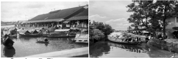
Gambar 7. Elemen multisensoris yang masih terlihat di tepi sungai Pasar Sekanak, namun terdapat penurunan aktivitas perdagangan

berdagang, tetapi juga ruang hidup yang sarat makna.