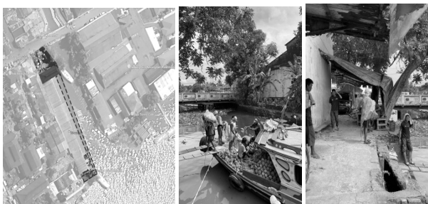
Gambar 9. Aktivitas masyarakat di tepi Sungai Pasar Sekanak

Banyak informan menggambarkan perubahan ini sebagai hilangnya “rasa pasar lama” bukan semata kehilangan bentuk fisik, tetapi kehilangan suasana dan kedekatan emosional terhadap ruang yang dulu hidup dan terbuka. Perasaan “jarak emosional” muncul karena pasar kini dianggap lebih formal dan kurang hangat dibandingkan masa sebelumnya. Namun demikian, keterikatan tempat tidak sepenuhnya hilang. Sejumlah pedagang lama tetap merasa nyaman dan memilih bertahan karena rutinitas harian, lokasi yang strategis, serta hubungan sosial dengan pelanggan dan sesama pedagang masih terjaga. Hal ini menunjukkan bahwa place attachment bersifat dinamis, dapat beradaptasi terhadap perubahan fisik dan sosial ruang.