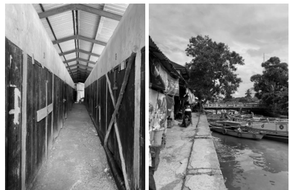
Gambar 6. Los dan Kios di dalam bangunan cenderung sepi, sedangkan kios di tepi sungai masih terlihat aktivitas perdagangan

Namun, pembangunan struktur pasar modern dengan sistem tertutup menyebabkan orientasi visual ke sungai terputus. Aktivitas dagang kini berpusat di dalam bangunan, sementara orientasi ke tepi air semakin berkurang. Akibatnya, citra pasar bergeser dari “pasar tepi air” menjadi “pasar darat modern.” Hal ini menunjukkan bahwa identitas ruang tidak sekadar ditentukan oleh bentuk fisik, tetapi juga oleh keterhubungan simbolik dengan lanskap ekologis yang melingkupinya.