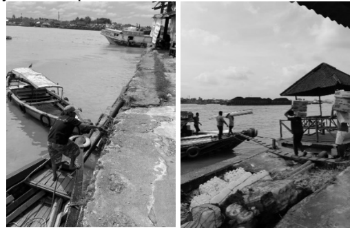
Gambar 5. Aktivitas masyarakat pada dermaga di tepi sungai

tidak hanya berperan sebagai elemen fisik, tetapi juga simbol kolektif yang meneguhkan identitas masyarakat riparian.