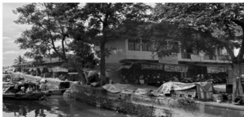
Gambar 4. Revitalisasi bangunan pasar yang dilakukan oleh pemerintah

Hal ini secara langsung mempengaruhi citra visual pasar dan bagaimana masyarakat “mengenali” Pasar Sekanak kini sebagai pasar modern. Identitas tempat (place identity) Pasar Sekanak terbentuk melalui relasi antara struktur ruang pasar dengan elemen air sebagai sumber kehidupan ekonomi dan sosial. Pada masa awal, identitas pasar bersifat terbuka dan menyatu dengan sungai. Kapal-kapal menjadi moda distribusi utama, dermaga berfungsi sebagai titik interaksi sosial, dan pemandangan aliran air menjadi latar visual yang memperkuat citra ruang. Dalam kondisi ini, sungai