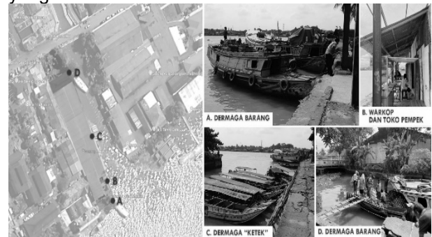
Gambar 10. Aktivitas komunitas perdagangan dan rekreasi di tepi Sungai Pasar Sekanak

Pasar Sekanak sebagai pasar riparian sejak lama membentuk komunitas yang hidup di tepian air — pedagang, nelayan, dan masyarakat sekitar berinteraksi melalui kegiatan ekonomi dan sosial sehari-hari. Sungai berperan sebagai saluran distribusi sekaligus ruang pertemuan informal tempat masyarakat berbagi informasi dan menjaga solidaritas. Keterhubungan antara aktivitas ekonomi dan budaya sungai menjadikan pasar sekadar ruang fungsional, tetapi juga simpul sosial-ekologis yang membentuk identitas komunitas lokal.