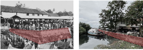
Gambar 3. Kanalisasi menyebabkan perubahan orientasi aktivitas masyarakat ke arah darat

serta lanskap sungai yang dahulu menjadi wajah pasar kini semakin terpinggirkan.