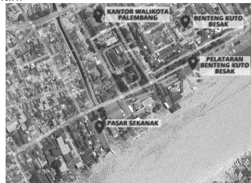
Gambar 1. Peta lokasi Pasar Sekanak

Pasar Sekanak merupakan salah satu pasar tertua di Kota Palembang yang merepresentasikan transformasi orientasi ekonomi masyarakat dari aktivitas air menuju aktivitas darat. Sejak masa kolonial Belanda, pasar ini berperan sebagai simpul distribusi hasil sungai seperti ikan dan kopra, sekaligus ruang interaksi sosial bagi komunitas riparian.