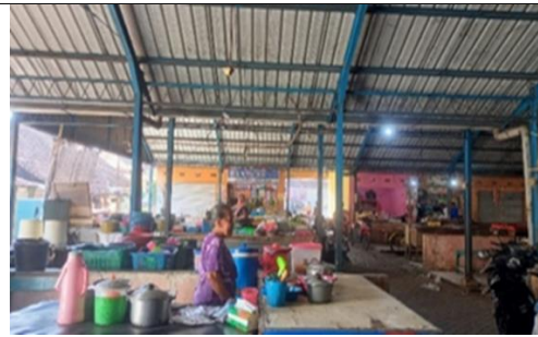
Gambar 5 Pasar Kering dan Basah (2)

Pasar kering dijumpai di Pasar Gempolkerep, namun penataannya tercerai berai. Pasar kering menjual sembako, plastik, peralatan rumah, pakaian, dll.