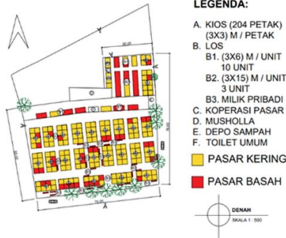
Gambar 2 Denah Pasar Gempolkerep

seringkali keluar masuk dari jalur Utara, Timur, dan Selatan. Jalur Utara dari sela rumah penduduk terdapat gang kecil. Di jalur Timur terdapat jalan selebar 2,5 meter yang diperuntukkan untuk sirkulasi keluar masuk. Di jalur Selatan dari jalan raya yang langsung masuk ke pasar dari sela-sela kios. Bagi pengunjung yang berjalan kaki dapat masuk ke pasar dari berbagai arah melewati sela-sela kios yang ada. Sedangkan bagi pengunjung maupun pedagang yang membawa kendaraan beroda empat atau tiga seringkali melewati jalur Timur, Selatan, dan Barat.