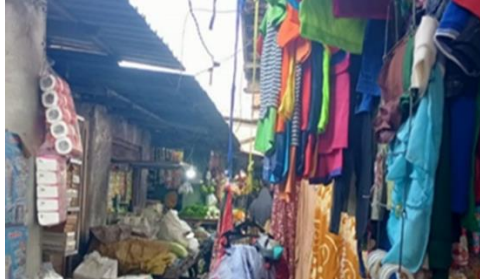
Gambar 8 Kios dengan Pasar Basah dan Kering

Hal ini tergambar pada gambar 7, pada pukul 10.06 WIB pedagang menjual daging ayam yang asalnya menjual sembako pada pukul 08.20 WIB. Pasar basah menjual buah, sayuran daging, dll. Di Pasar Gempolkerep tidak ada pembagian spesifik antara penjualan daging halal dan haram. Hal ini dikarenakan pasar basah menjual daging halal seperti sapi, ikan, dan ayam.