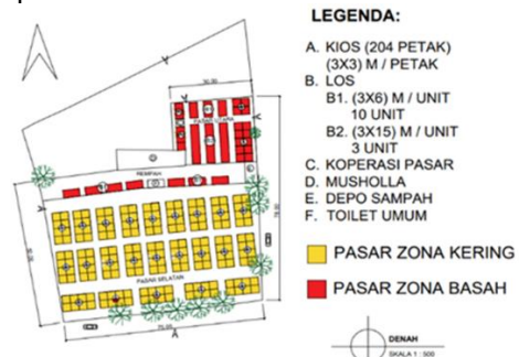
Gambar 10 Solusi Zona Ruang Pasar Gempolkerep

Berikut gambaran solusi untuk pembagian zonasi pasar basah dan kering dengan alternatif meletakkan partisi atau buffer berupa kios rempah untuk mengurangi bau yang ada serta pemisahan zonasi yang tepat.