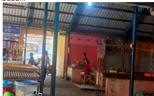
Gambar 7 Los Pasar Basah Pukul 10.06 WIB

Penataan pasar basah di Pasar Gempolkerep juga tercerai berai. Terkadang apabila kios dari pasar kering sudah tutup maka dipakai untuk salah satu kios basah.