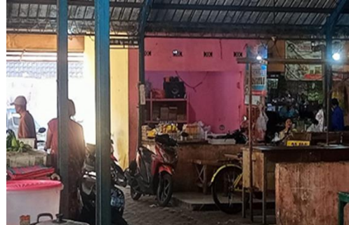
Gambar 6 Los Pasar Kering Pukul 08.20 WIB

Pasar kering dijumpai di Pasar Gempolkerep, namun penataannya tercerai berai. Pasar kering menjual sembako, plastik, peralatan rumah, pakaian, dll.