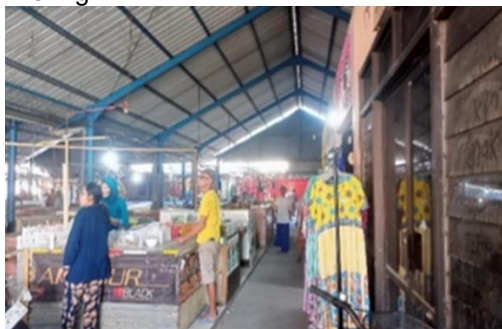
Gambar 4 Pasar Kering dan Basah (1)

Gambar 3 Kondisi Pasar Gempolkerep Pukul 07.10 WIB Dalam penerapannya di Pasar Gempolkerep, kios ataupun los antara pasar basah dan pasar kering tidak tertata. Sehingga zonasi pedagang tampak kacau dan menimbulkan beberapa masalah. Maka permasalahan tersebut harus ditangani. Zona pada Pasar Gempolkerep kerap kali tidak terbagi dengan maksimal. Terdapat penyimpangan zona pasar basah dan kering yang kerap dijadikan satu. Kedekatan antara zonasi pasar basah dan pasar kering menimbulkan permasalahan yaitu aroma dari pasar basah mengganggu pengunjung pasar kering.