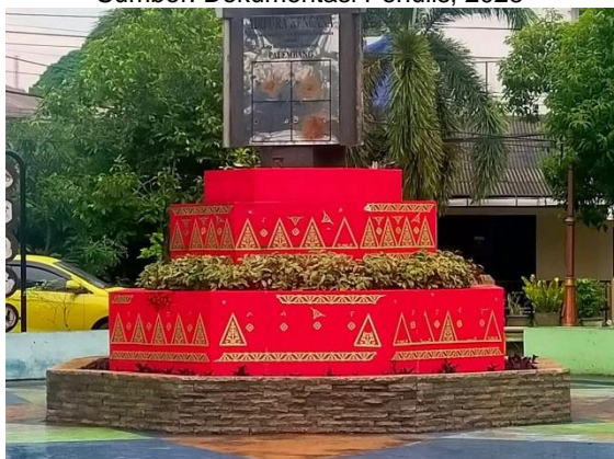
Gambar 5. Taman Kota Palembang