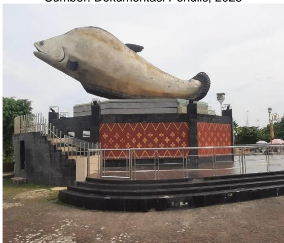
Gambar 4. Tugu Ikan Belido BKB