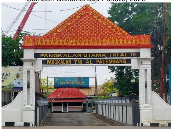
Gambar 3. Pangkalan Utama TNI AL