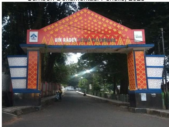
Gambar 8. Gerbang UIN Raden Fatah Kota Palembang