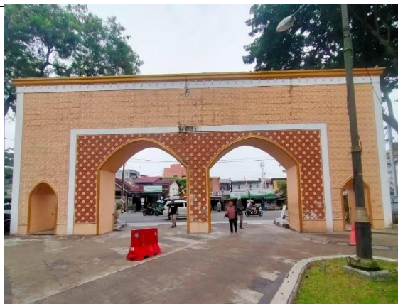
Gambar 6. Gerbang Masjid Agung Kota Palembang