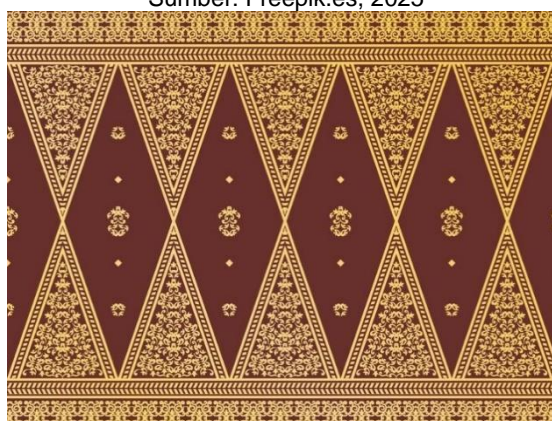
Gambar 2. Motif Pucuk Rebung