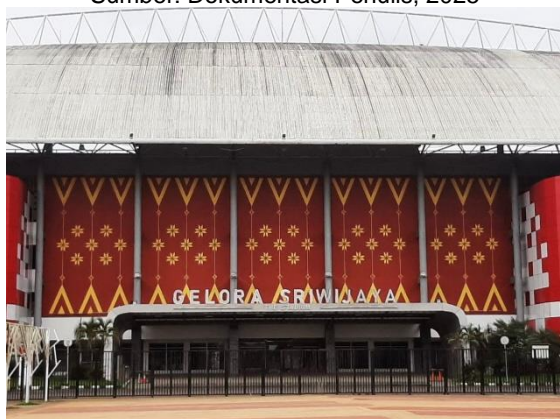
Gambar 7. Stadion Gelora Sriwijaya (Jakabaring)