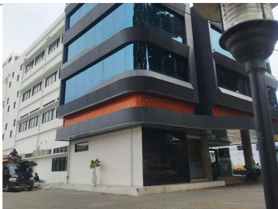
Gambar 2. Kanwil Pegadaian Kota Palembang