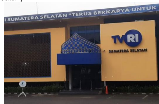
Gambar 1. Kantor TVRI