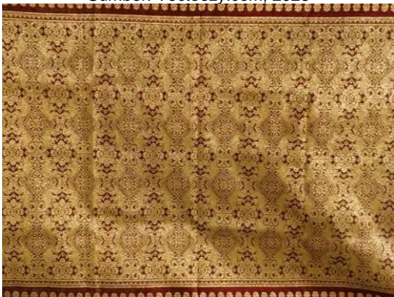
Gambar 2. Motif Nago Besaung

Dalam perkembangan arsitektur modern, motif Kain Songket Palembang diadaptasi sebagai ornamen pada bangunan, ruang publik dan infrastruktur. Pemerintah Kota Palembang secara aktif memperkenalkan motif songket melalui ornamen pada gedung pemerintahan, sekolah, gerbang, tembok pagar dan bangunan lainnya. Penerapan motif kain songket pada ruang publik tidak hanya sebagai penghargaan terhadap warisan budaya, tetapi juga sebagai upaya membangun identitas visual kota dan meningkatkan daya tarik wisata. Penggunaan motif songket pada arsitektur dilakukan dengan berbagai teknik, seperti aplikasi ukiran kayu, aluminium composite panel, cetakan semen dan cat dekoratif. Motif-motif tersebut biasanya disusun secara simetris dan berulang untuk menciptakan harmoni visual yang dinamis. Selain memperindah bangunan, motif songket juga mengandung pesan, makna, dan nilai-nilai budaya yang dapat menjadi media edukasi bagi masyarakat dan pengunjung (Mubarat dkk., 2022).