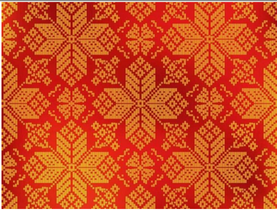
Gambar 2. Motif Bintang Berante