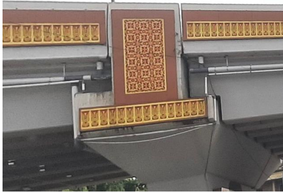
Gambar 10. Flyover Simpang Sekip Sumber: Dokumentasi Penulis, 2025

Seiring perkembangan zaman, beberapa penerapan motif kain songket pada bangunan modern cenderung hanya menonjolkan aspek keindahan visual, sementara makna filosofisnya mulai terpinggirkan. Hal ini dapat dilihat dari motif-motif yang hanya dipilih karena keindahan bentuk, bukan lagi berdasarkan nilai-nilai budaya yang terkandung di dalamnya. Selain itu, hasil observasi di lapangan menunjukkan bahwa tidak semua penerapan motif kain songket pada bangunan dan ruang publik memperhatikan kaidah estetika secara optimal. Terdapat ketidaksesuaian antara bentuk, motif dan warna, sehingga terkesan dipaksakan dan kurang harmonis.