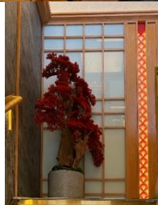
Gambar: (1), (2), dan (3)

Pada gambar (1) dapat dilihat elemen estetis pendukung berupa tanaman hias sintetis menjadi nuansa yang baru bagi konsep co-branding ini serta memperkuat nuansa Jepang secara umum, kemudian gambar (2) ini adalah elemen yang biasanya diterapkan pada interior restoran RamenYa juga masih diterapkan dengan komposisi yang seimbang sehingga tidak terkesan mendominasi ruangan. Gambar (3) menyerupai bentuk pintu khas rumah tradisional Jepang dengan permainan aksesoris merah berbentuk motif bunga sakura juga semakin memperkuat identitas kedua brand.