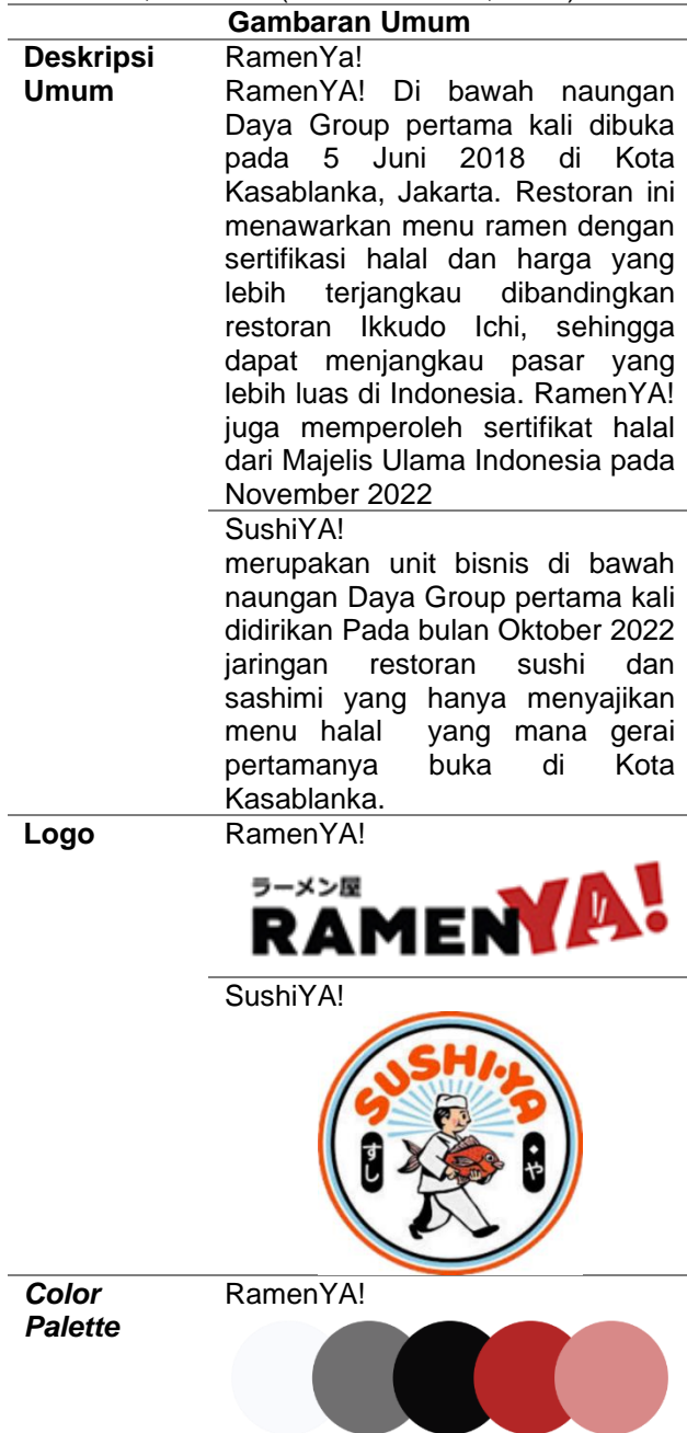
Tabel 1. Gambaran Umum Perbandingan RamenYa! X SushiYa

Warna yang digunakan sesuai dengan identitas logo RamenYa yang berwarna Merah, hitam, Abu, Putih SushiYA!