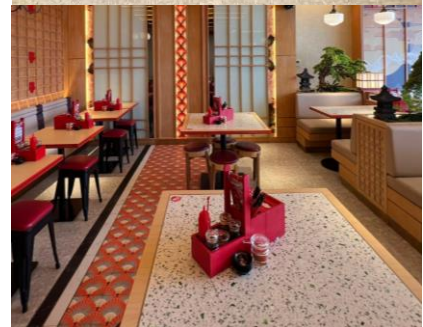
(A) Elemen Lantai

Pada gambar (A) dapat dilihat material lantai pola grid warna yang diterapkan pada restoran SushiYa diterapkan pada sebagian area yang bertujuan mempertegas jalur sirkulasi, berikutnya pada tangga dan sirkulasi lantai 2 juga terlihat permainan material keramik yang biasa diterapkan pada restoran RamenYa sehingga komposisi ini dinilai sangat proporsional bagi penguatan identitas visual bagi kedua brand.