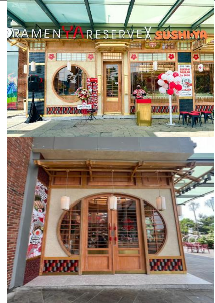
(A) Fasad dan Eksterior

Pada bagian fasad yang dapat dilihat pada gambar (A), warna krem, putih dan aksesoris coklat tua menjadi tone warna utama yang dikonsepsikan dengan upaya penyeimbang dari citra brand RamenYa maupun SushiYa. Dengan begitu masing-masing brand tetap menonjol secara visual.