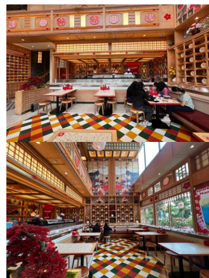
(B) Indoor Lantai 1

Pada bagian fasad yang dapat dilihat pada gambar (A), warna krem, putih dan aksesoris coklat tua menjadi tone warna utama yang dikonsepsikan dengan upaya penyeimbang dari citra brand RamenYa maupun SushiYa. Dengan begitu masing-masing brand tetap menonjol secara visual.