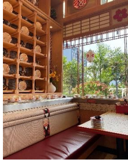
(B) Elemen Dinding

Pada gambar (B) dapat dilihat material dan tekstur yang di terapkan sangat detail dan melengkapi semua identitas visual yang di tonjolkan pada restoran sushiYa dengan diperkuat aksesoris warna biru. Kemudian rak rak khas dari restoran RamenYa juga ikut menghiasi dengan kombinasi warna coklat muda, merah, biru dan kuning dengan permukaan yang halus membuat kesan desain yang detail sehingga pengunjung merasa nyaman.