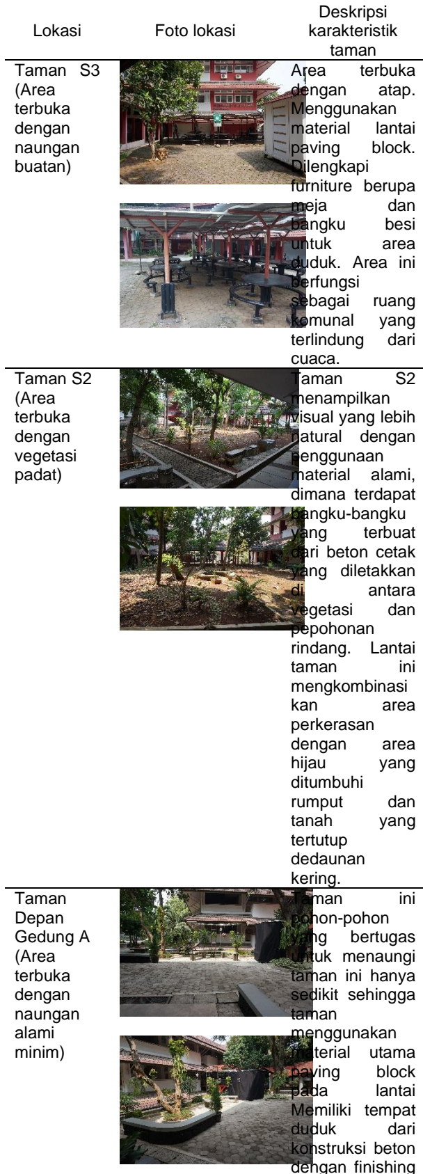
Tabel 2. Foto lokasi dan deskripsi karakteristik taman.

Lokasi penelitian mencakup tiga area taman berbeda di Departemen Arsitektur Fakultas Teknik Universitas Diponegoro seperti terlihat pada Gambar 1. dan Tabel 2. berikut ini: