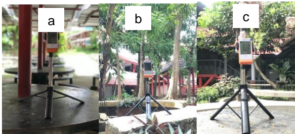
Gambar 2. Lokasi Penempatan Data Logger (a.) Taman S3, (b.) Taman S2, (c.) Taman Depan Gedung A

Pengumpulan data primer dilakukan menggunakan Digital Temperature and Humidity Data Logger yang ditempatkan pada posisi tegak di setiap lokasi seperti yang terlihat pada Gambar 2.