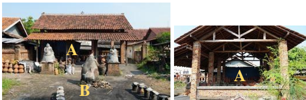
Gambar 2. Sosok Seluruh Bangunan dan Konstruksi Bangunan.

Atas: Galeri lama (A, digambar ulang), Pembakaran tradisional (B, digambar ulang), Pembakaran modern (C), Kuliner-souvenir (D), ruang duduk (E), Cuci tangan-toilet (F).