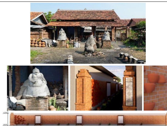
Gambar 5. Ornamen Lama dan Baru.

Ornamen galeri lama masih bertahan, yaitu dua buah dimuka galeri lama dan satu buah di muka tempat pembakaran lama, dan dipertahankan apa adanya (Gambar 5). Ornamen gerabah baru diposisikan pada dinding jalan masuk, sebagai tanda pengenalan Pusat Wisata Gerabah.