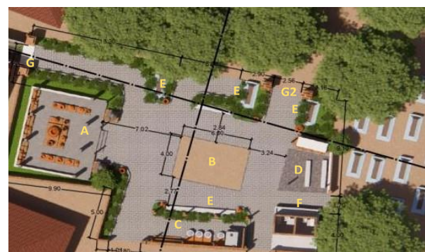
Gambar 3. Tata Ruang Bangunan Wisata Gerabah

A-Galeri lama. B-Tempat pembakaran lama. C-Tempat pembakaran modern. D-Ruang kuliner. E-Tempat duduk. F-Bangunan cuci tangan dan toilet. G-Gerbang lama. G2- Gerbang lama ke pemakaman.