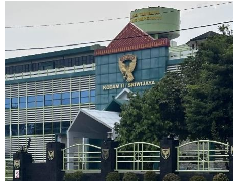
Gambar 4. Kodam II Sriwijaya