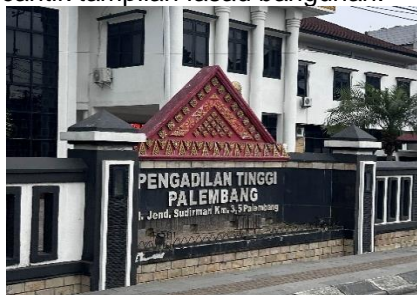
Gambar 2. Pengadilan Tinggi Palembang

Seperti yang bisa dilihat pada gambar 1, gedung TVRI menerapkan motif tanjak dengan warna dasar biru dan hiasan ukiran emas pada fasadnya. Namun, pada umumnya, tanjak berwarna dasar merah dengan ukiran emas lebih sering digunakan untuk mempercantik tampilan fasad bangunan.