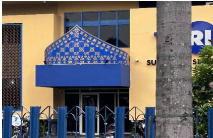
Gambar 2. TVRI Palembang

Berikut bangunan-bangunan instansi pemerintahan yang mengadopsi Tanjak sebagai bentuk penerapan budaya lokal :