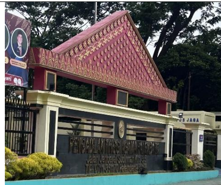
Gambar 3. Pengadilan Tinggi Agama Palembang