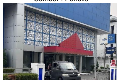
Gambar 7. Taspen