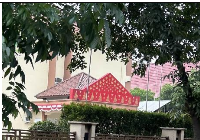
Gambar 8. Kantor Wilayah BPN

Berdasarkan beberapa gambar di atas, dapat dilihat bahwa penggunaan tanjak dengan warna dasar merah memang mendominasi wilayah Kota Palembang. Dalam kultur masyarakat Palembang, warna merah memiliki makna yang penting dan simbolis. Warna ini sering kali melambangkan kekuatan, keberanian, serta semangat yang tinggi.