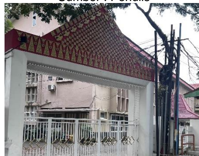
Gambar 6. BAPPEDA Sumatera Selatan