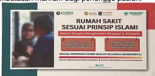
Gambar 4. Himbauan Prinsip Rumah Sakit Islami pada Rumah Sakit Roemani Muhammadiyah

Dengan adanya elemen tersebut RSMA wajib mengikuti standar yang ditetapkan dalam menjalankan operasional rumah sakit. Selain mencakup elemen tersebut, RSMA memiliki prinsip pembatasan mahram bagi penunggu pasien.