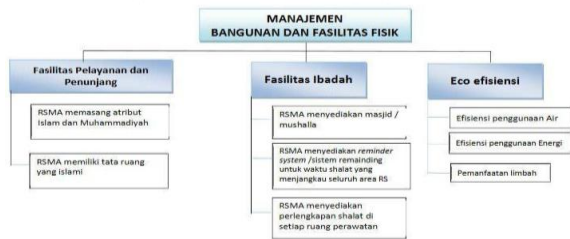
Gambar 3. Skema manajemen bangunan dan fasilitas fisik Rumah sakit Muhammadiyah & Aisyiyah