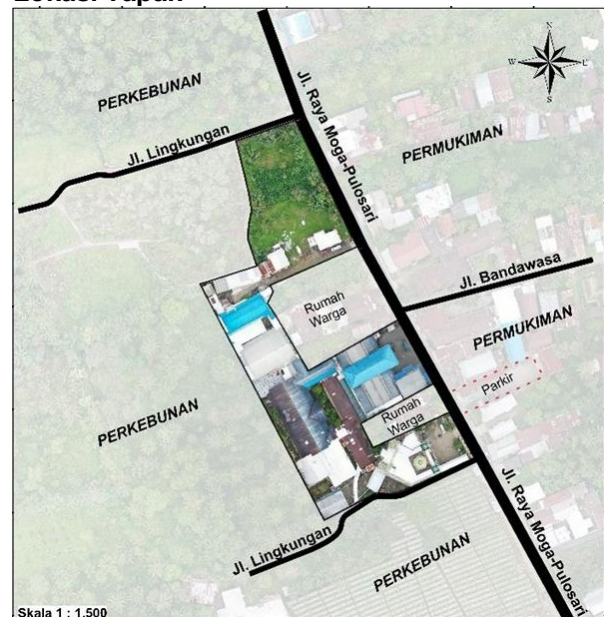
Gambar 2. Lokasi Tapak RS Muhammadiyah Rodliyah Achid