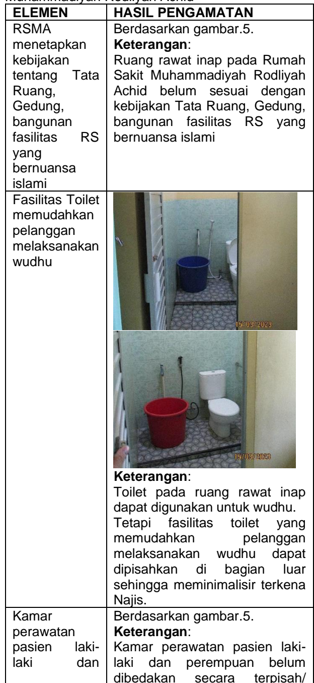
Tabel 2. Tata ruang/ bangunan Islami Rumah Sakit Muhammadiyah Rodliyah Achid