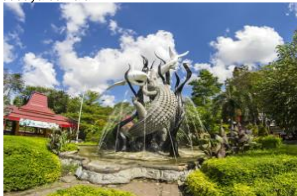
Gambar 1. Patung Suro-Boyo

Patung Suro-Boyo tidak hanya berfungsi sebagai simbol kota, tetapi juga sebagai pusat pertemuan dan interaksi sosial. Keberadaannya di Kebun Binatang Surabaya memberikan konteks historis dan budaya yang mendalam, menjadikannya sebagai landmark yang menghubungkan berbagai elemen sejarah dan mitos lokal. Patung ini berfungsi sebagai elemen landmark dalam kognisi spasial Lynch, di mana ia membantu penduduk dan pengunjung dalam orientasi dan identifikasi tempat. Integrasi patung ini dengan kebun binatang juga menekankan pentingnya elemen sejarah dalam ruang publik, menciptakan pengalaman visual yang menyatukan budaya dan alam.