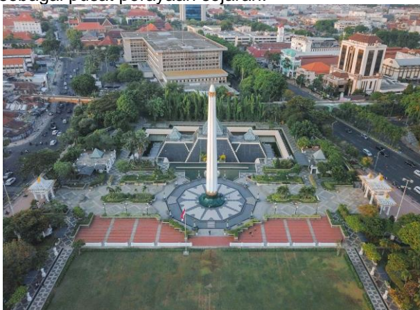
Gambar 2. Kawasan Tugu Pahlawan dan Museum Sepuluh Nopember

memunculkan persepsi bagi masyarakat bahwa adanya interkoneksi antara Tugu Pahlawan dengan Museum Sepuluh Nopember sebagai satu kesatuan objek yang menyimpan nilai sejarah, khususnya peristiwa 10 November 1945. Terdapatnya lapangan yang biasa digunakan untuk peringatan hari-hari besar, mempertegas bahwa inilah pusat peringatan di Kota Pahlawan, Surabaya. Oleh karena itu, dari segi bentuk kognisi spasial dapat dikatakan bahwa Tugu Pahlawan dan Museum Sepuluh Nopember sebagai landmark Kota Pahlawan. Selain itu, Tugu Pahlawan dan Museum Sepuluh Nopember merupakan contoh yang jelas dari bagaimana elemen historis dapat berfungsi sebagai district dalam konteks kognisi spasial Lynch. Kedua objek ini tidak hanya berperan sebagai landmark peringatan sejarah, tetapi juga sebagai pusat kegiatan masyarakat dan perayaan. Tugu Pahlawan yang berdiri megah menggambarkan identitas kota sebagai "Kota Pahlawan," sementara Museum Sepuluh Nopember menambah lapisan informasi sejarah yang memperkuat makna tugu tersebut. Penambahan lapangan di sekelilingnya menyediakan ruang terbuka yang mendukung berbagai acara dan kegiatan, memperkuat perannya sebagai pusat perayaan sejarah.