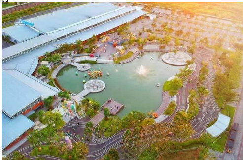
Gambar 8. Food Junction Grand Pakuwon Surabaya

karakteristik fitur fasad yang berbeda yaitu antara fasilitas atau hunian masyarakat kelas bawah dengan masyarakat kelas menengah atas atau kalangan elit.