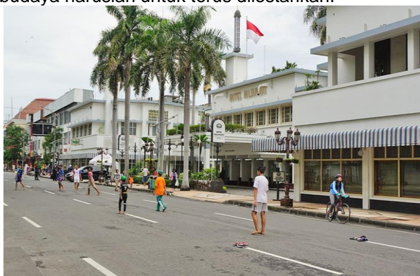
Gambar 9. Hotel Majapahit

Landmark merupakan kategori pada elemen bentuk kognisi spasial citra kota yang tepat dari Hotel Majapahit. Karena hotel ini menjadi objek simbol kegigihan berjuang dan mempertahankan kemerdekaan Indonesia yang baru saja terjadi. Selain itu gaya arsitektur klasik yang masih dipertahankan pada hotel ini, ingin memberikan persepsi bahwa di tengah megahnya kota metropolitan, arsitektur klasik yang sering dianggap kuno masih dengan cocoknya mendampingi. Telah dijadikannya Hotel Majapahit sebagai cagar budaya juga memberikan pesan bahwa peninggalan sejarah budaya haruslah untuk terus dilestarikan.