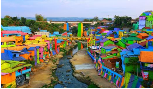
Gambar 5. Kawasan Kampung Bulak

Kesan persepsi yang timbul dari warna-warni bangunan ialah mencerminkan keberagaman etnis dan budaya masyarakat yang tinggal di Kota Surabaya. Kampung Bulak berbatasan dengan tepian pantai. Sehingga pada pagi hari dapat menyaksikan matahari terbit secara langsung. Berdasarkan inilah Kampung Bulak merupakan elemen batas ( edge ) dari bentuk kognisi spasial terhadap citra kota. Terdapatnya batas antara tepian pantai dengan daratan (Kampung Bulak) secara alami menjadi ciri dari elemen batas ( edge ) ini.