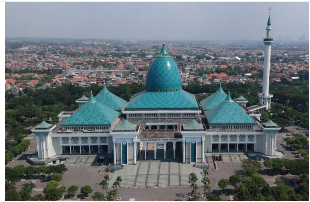
Gambar 3. Masjid Nasional Al-Akbar

Masjid Nasional Al-Akbar Surabaya atau yang biasa dikenal dengan nama Masjid Agung Surabaya merupakan masjid terbesar kedua di Indonesia. Perpaduan yang sangat pas antara masjid terbesar kedua yang berada di kota terbesar kedua di Indonesia. Kehadiran Masjid ini di tengah kehomogenian agama mencerminkan bahwa agama Islam adalah agama mayoritas di Kota Surabaya. Gaya arsitektur masjid yang bergaya timur tengah ini terlihat dari bentuk kubah yang menyerupai piramida. Hal ini memberikan persepsi bahwa arsitektur masjid mencoba untuk menggabungkan nilai-nilai budaya di tengah-tengah kemodernan. Dari perspektif kognisi spasial, masjid ini berperan sebagai elemen landmark yang menandai pusat religius kota dan memberikan identitas visual yang kuat. Kehadirannya juga menciptakan zona transisi antara area urban dan spiritual, menegaskan integrasi antara kehidupan modern dan warisan budaya.