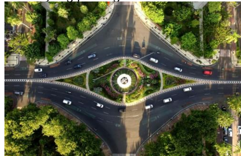
Gambar 7. Kawasan Monumen Bambu Runcing

Persepsi yang muncul dari keberadaan Monumen Bambu Runcing ini adalah lagi-lagi ingin menyampaikan pesan perjuangan ke setiap sudut Kota Pahlawan. Bambu runcing merupakan senjata utama arek-arek suroboyo dalam perang kemerdekaan. Bambu runcing menjadi simbol perlawanan sekaligus perjuangan dalam mempertahankan kemerdekaan. Letak Monumen Bambu Runcing yang sebagai titik temu ( pivot ) antara Jalan Panglima Sudirman dengan Jalan Embong Ploso dan Jalan Embong Sawo, menjadikan jalan pada monumen ini berada dalam kategori elemen simpul ( node ). Di mana simpul ( node ) yang terbentuk dari pertemuan antar jalan jika dilihat dari foto udara menyerupai bentuk mata. Penempatan monumen di persimpangan penting dan desain yang menyerupai mata menandakan peran strategisnya dalam struktur spasial kota, mengarahkan perhatian dan orientasi masyarakat serta pengunjung. Simbol perjuangan yang diwakili oleh bambu runcing menguatkan pesan sejarah dan nilai-nilai perjuangan kemerdekaan, menjadikannya pusat visual yang penting.