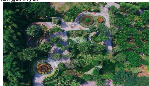
Gambar 4. Taman Bungkul

Dari segi bentuk kognisi spasial terhadap citra kota, Taman Bungkul dapat dikategorikan sebagai district (kawasan). Di mana ini dikarenakan letak Taman Bungkul yang berada di tengah-tengah pusat kota. Taman Bungkul menjadi sebuah kawasan yang berbeda dari daerah di sekitarnya. Sekaligus memunculkan persepsi pentingnya ruang terbuka hijau (lingkungan) di tengah kepadatan kota. Persepsi lain yang muncul adalah bahwa Kota Surabaya sebagai statusnya kota metropolitan terbesar kedua tetap peduli dengan kondisi lingkungan. Juga memunculkan persepsi untuk memadukan antara kemodernan kota dengan alam yaitu dengan tersedianya akses layanan internet nirkabel di Taman Bungkul sebagai alam atau lingkungannya.