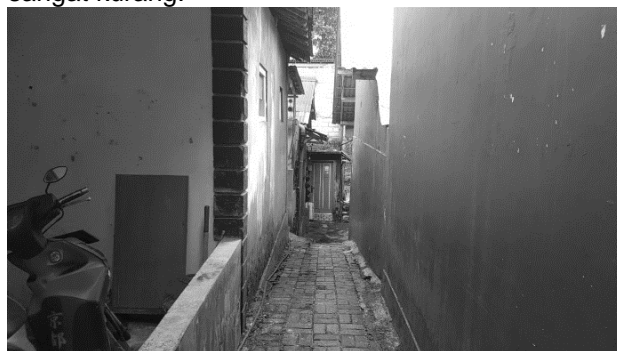
Gambar 7. jarak antar rumah yang sempit.

Gambar 6. Penampakan peralon yang di ekspose ke luar Permukiman pinggir sungai Semagung menurut informan mempunyai kondisi permukiman yang kurang sehat hal ini dikarenakan lahan yang terbatas akan tetapi digunakan untuk pemenuhan rumah tinggal yang tinggi, sehingga bangunan-bangunan atau rumah yang ada pada kawasan ini mempunyai keterbatasan dalam hal, sanitasi yang buruk, pencahayaan alami yang kurang dan kebersihan yang kurang. Kesadaran masyarakat untuk membuat lingkungan lebih sehat bisa dikatakan sangat kurang.