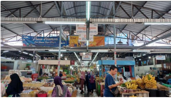
Gambar 13. Situasi di dalam Pasar Gede

Dalam kurun waktu 5 tahun terakhir, perekonomian di Pasar Gede mengalami fluktuasi. Hal ini dipengaruhi juga oleh pandemi Covid-19 pada awal tahun 2020. Sebelum pandemi berlangsung, Pasar Gede belum sepenuhnya ramai dengan persentase pendapatan pedagang mencapai 80%. Semenjak pandemi berlangsung, pendapatan turun drastis hingga mencapai persentase 20% saja. Namun, perekonomian di Pasar Gede bisa kembali bangkit setelah pandemi berakhir. Kenaikan ini mencapai 2 kali lipat dari kondisi sebelum pandemi yakni ke angka 160%. Hal ini juga dipengaruhi oleh pengembangan infrastruktur dan objek pariwisata di Surakarta dan sekitarnya seperti pembangunan jalan tol, pembangunan Masjid Raya Sheikh Zayed dan Solo Safari.