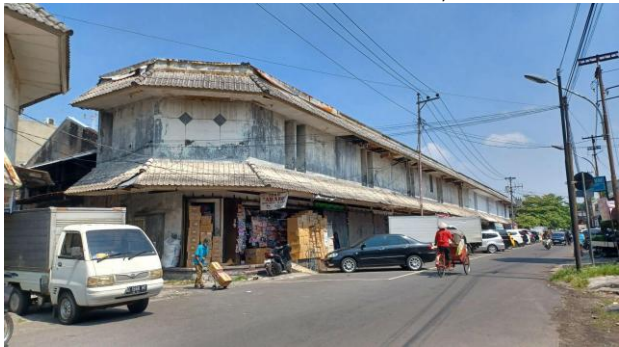
Gambar 7. Ruko di Jalan Utara Pasar Gede

Kondisi dinding di fasad bangunan pada ruko-ruko ini sudah mengalami pengelupasan. Atap pada bangunan juga mengalami pemudaran warna. Meski begitu, secara umum ruko masih berdiri kokoh. Beberapa ruko juga telah beralih fungsi menjadi gudang barang dan masih digunakan untuk usaha. Adapula bangunan kosong yang tidak lagi digunakan untuk ruko.