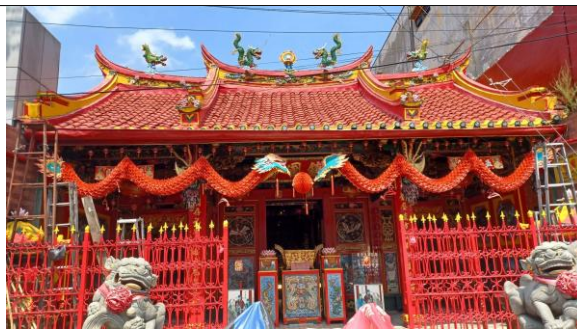
Gambar 4. Kelenteng Tien Kok Sie

Pengaruh arsitektur tradisional Cina sangat terlihat jelas dari fasad kelenteng ini. Atap kelenteng berbentuk landai dengan jenis atap jurai ( pitched roof atau wu tien ) dengan adanya ornamen naga dan ayam di atasnya. Pada fasad kelenteng, terdapat ornamen berupa 2 ekor naga yang menggantung di bawah lisplang. Enrisca (2008) dalam Wulanningrum (2018) mengatakan bahwa ornamen pada kelenteng menjadi sarana penyampaian konsep, ajaran, dan falsafah dalam kehidupan masyarakat. Ornamen ini biasanya terdiri dari ornamen bermotif hewan, tumbuhan, fenomena alam, lambang geometris, dan tokoh dan memiliki maknanya masing-masing.