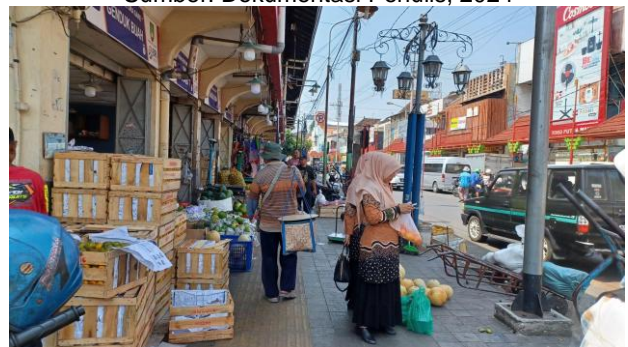
Gambar 10. Jalur pejalan kaki di sisi selatan bangunan utama Pasar Gede

Bangunan ruko di kawasan pecinan sekitar Pasar Gede masih mempertahankan keaslian massa/bentuk, fasad, dan atap bangunan. Selain itu, terdapat 2 ikon di kawasan ini berupa Kelenteng Tien Kok Sie dan Pasar Gede yang juga mendukung nilai bangunan dari segi historis. Dengan masih mempertahankan keasliannya, bangunan di kawasan pecinan sekitar Pasar Gede ini masih memiliki kualitas visual yang dapat dikembangkan sebagai salah satu kawasan pusaka niaga di Surakarta.