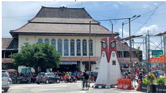
Gambar 5. Fasad Depan Pasar Gede dan Tugu Jam

Pasar ini dirancang oleh arsitek Belanda Thomas Karsten dengan memadukan dua corak yakni arsitektur Jawa dan Eropa (Indis) yang saat itu diterapkan di banyak bangunan di Hindia Belanda. Perancangan dinding dan penggunaan material pasar dipengaruhi oleh arsitektur Eropa, sedangkan bentuk atap dan wuwungan dipengaruhi oleh arsitektur Jawa. Proses perancangan Pasar Gede dilakukan dengan mempertimbangkan budaya lokal terlebih dahulu, karena Thomas Karsten ingin menjaga kelestarian budaya setempat. (Herlambang et al., 2017 dalam Pramudito et al, 2022).