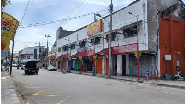
Gambar 6. Deretan ruko yang dibangun dengan satu struktur bangunan yang sama dan memiliki fasad yang mirip di Jalan R.E. Martadinata Sumber: Dokumentasi Penulis, 2024

Pasar Gede pada tahun 1930 sebagai hunian dan toko masyarakat keturunan Tionghoa kala itu. Hal ini mengakibatkan ciri khas arsitektur Cina pada fasad depan tidak terlalu mencolok. Bangunan dirancang dengan lebih memperhatikan aspek fungsi. Terdapat beberapa ruko yang awalnya dibangun menjadi satu struktur dan fasad bangunan yang sama. Fasad ini masih dipertahankan hingga saat ini dengan fungsi yang sama.