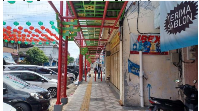
Gambar 9. Rangka kanopi di sepanjang jalur pejalan kaki di Jalan R.E. Martadinata

Gambar 8. Fungsi bangunan pada area penelitian di kawasan pecinan sekitar Pasar Gede Adapun pada jalur pejalan kaki terdapat furnitur jalan berupa rangka kanopi di jalur pejalan kaki. Rangka kanopi ini diinstal pada 2021 sebagai salah satu upaya untuk menunjukkan eksistensi kampung pecinan Sudiroprajan menjadikan kampung ini sebagai kampung kuliner pecinan. Rangka ini dicat warna merah untuk menunjukkan identitas masyarakat keturunan Tionghoa karena warna merah memiliki makna budaya dan simbolis yang signifikan di budaya Cina. Warna merah menunjukkan simbolisme keberuntungan dan kegembiraan, simbolisme berupa perlindungan dari roh jahat, perayaan, dan identitas estetika dan budaya. Adapun furnitur jalan lainnya berupa lampu jalan yang berada di sepanjang jalur pejalan kaki.