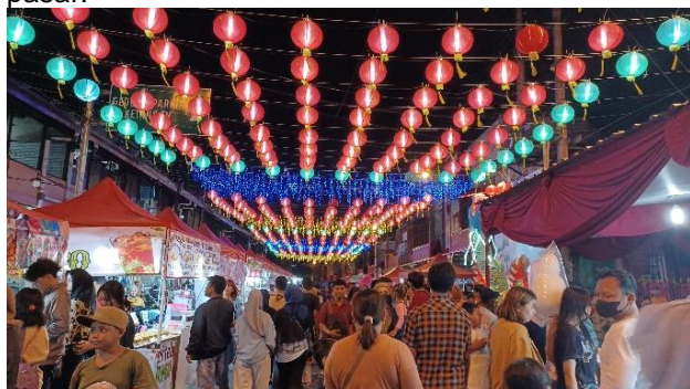
Gambar 11. Perayaan Tahun Baru Cina (Imlek) di Jalan Urip Sumoharjo

Organisasi-organisasi ini memanfaatkan kawasan pecinan di sekitar Pasar Gede untuk mengadakan kegiatan-kegiatan. Salah satu kegiatan dari organisasi di luar kawasan adalah acara Tahun Baru Cina oleh komunitas Imlek Bersama dan Persatuan Masyarakat Surakarta (PMS) dengan memanfaatkan Jalan Urip Sumohardjo di depan Pasar Gede dan Tugu Jam. Tidak hanya mengadakan acara di jalan utama, lantai 2 dari bangunan Pasar Gede barat juga disewakan untuk umum. Beberapa acara dari komunitas dan pemerintah kota juga memanfaatkan ruang ini untuk melaksanakan sosialisasi kepada para pedagang pasar.