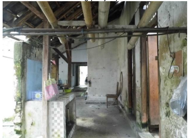
Gambar 7. Interior Bangunan Ketiga

Wisma kartowibowo yang berdenah L membuat bangunan ketiga membujur dari timur ke barat ketiga membujur pertama dan kedua membujur dari selatan ke utara. Unit ketiga memiliki paviliun di paling baratnya. Bangunan ini terbagi menjadi 8 ruang yang berfungsi sebagai ruang kamar mandi serta ruang penyimpanan.