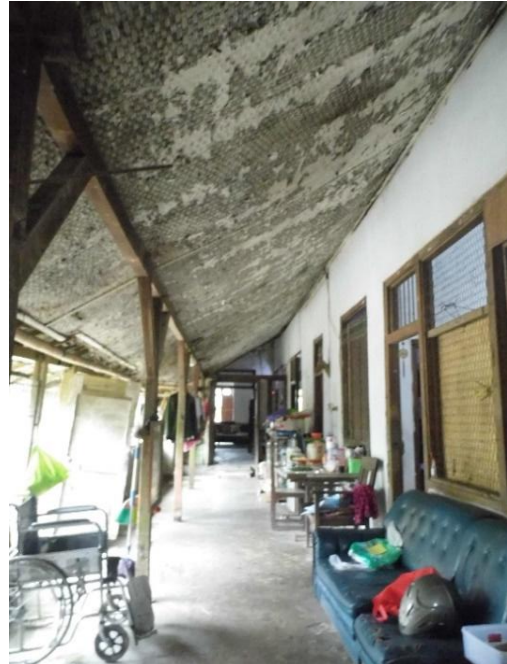
Gambar 6. Interior Bangunan Kedua Wisma Katowibowo

Bangunan unit kedua merupakan bangunan servis dengan atap yang menyatu dengan bangunan utama. Bangunan ini terletak di sisi utara bangunan utama dan merupakan bangunan linier memanjang membujur ke dari selatan ke utara (koridor). Terdapat tiga kamar tidur, sebuah dapur, dan sebuah kamar mandi. Bangunan ini didominasi oleh pintu dan jendela bertipe tunggal yang terbuat dari kusen serta memiliki plafon/ ceiling yang masih menggunakan anyaman bambu.