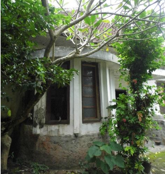
Gambar 4. Ruang Kupingan Kiri Tampak Dalam dan Tampak Luar