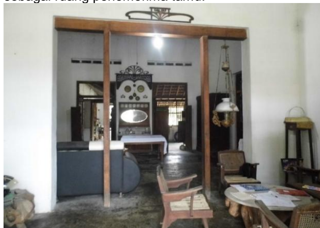
Gambar 3. Ruang Tamu dan Ruang Keluarga yang Dibatasi 2 Pilar

Tata ruangnya dibuat dengan menempatkan ruang utama (central room) di bagian depan yang berfungsi sebagai ruang penenerima tamu.