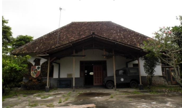
Gambar 3. Tampak Depan Wisma Katowibowo

Bangunan pertama atau utama diawali oleh pendopo yang beratap perisai dengan nok atap berorientasi barat-timur. Penutup atapnya dari genting, penutup lantainya plester, dan dinding bangunannya bercat putih. Bangunan utama menghadap ke selatan.. Wajah depan (fasad) berornamen garis vertikal dan horizontal yang dibentuk oleh elemen pintu dan jendela.