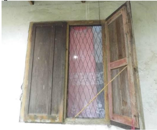
Gambar 8. Jendela Tipe Kupu Tarung

Bangunan ini beratap pelana dengan nok atap berorientasi dari timur ke barat. Jendela dan pintu pada bangunan ketiga didominasi oleh tipe kupu tarung.