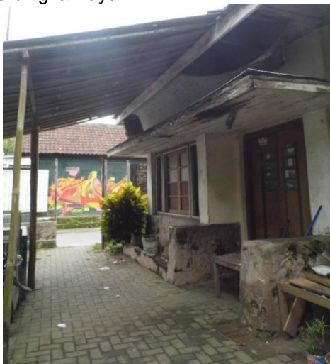
Gambar 9. Paviliun Pada Bangunan Ketiga

Bangunan ini memiliki paviliun di paling ujung barat dengan ornamen vertikal dan horisontal yang dibentuk dari elemen pintu dan jendela yang dilengkapi dua buah pilar kayu penunjang. Paviliun berfungsi sebagai pelindungan dari panas dan tampias hujan. Pada permukaan dinding paviliun ditempatkan satu pintu berbentuk kupu tarung. Terdapat pula jendela berbentuk kupu tarung yang ditempatkan berjajar di samping kanan pintu dengan aksesoris batang-batang kayu yang disusun secara horisontal. Pada dinding samping selatan juga ditempatkan sebuah jendela berbahan kaca dan berbingkai kayu.