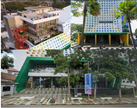
Gambar 4. Ruang terbuka bangunan Bandung Creative Hub