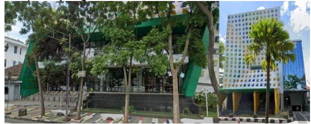
Gambar 6. Fasad transparan bangunan sisi barat dan selatan

yang memasuki bangunan dan menciptakan tampilan yang modern dan menarik secara visual.