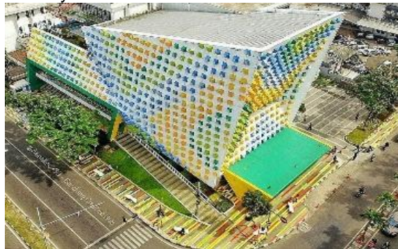
Gambar 3. Fasad Bangunan Bandung Creative Hub

pada fasad bangunan mencerminkan pendekatan desain yang kreatif dan inovatif. Bangunan ini dengan jelas berbeda dengan bangunan-bangunan konvensional, dan hal ini mungkin menjadi daya tarik tersendiri bagi pengunjung atau masyarakat yang melihatnya.