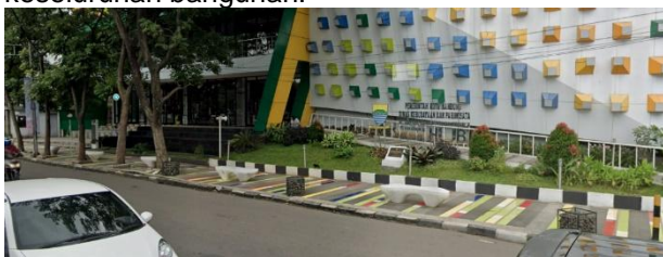
Gambar 5. Trotoar Bangunan Bandung Creative Hub Memiliki fasad transparan

Meskipun ruang luar Bandung Creative Hub terbatas, ruang luar tersebut memberikan suasana yang menyenangkan dan menyatu dengan desain keseluruhan bangunan.