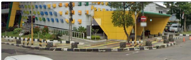
Gambar 8. Lanskap Area Bangunan Bandung creative Hub