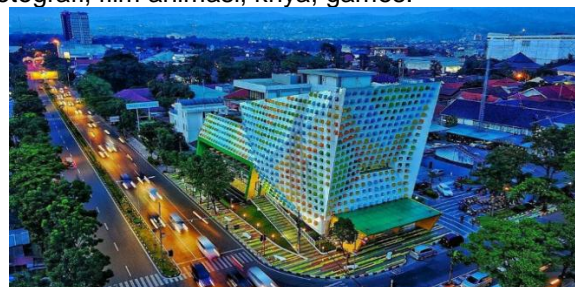
Gambar 1. Bandung Creative Hub

Bandung creative hub merupakan salah satu bangunan pusat pengembangan industri kreatif yang berada di Jawa Barat, lebih tepatnya berada di Jl. Laswi No.7, Kacapiring, Kec. Batununggal, Kota Bandung, Jawa Barat 40271. Creative center ini memiliki luasan sekitar 10.000 meter persegi dan terbagi dalam enam lantai, namun banyak lantai yang dapat dioperasikan berjumlah 5 lantai. Bandung creative hub di desain oleh arsitek Indonesia yaitu Ridwan Kamil yang tidak lain juga merupakan gubernur Jawa Barat. Bandung Creative Hub adalah sebuah inisiatif yang diresmikan pada tahun 2017 untuk menyediakan ruang dan fasilitas bagi para seniman dan pelaku kreatif di berbagai sub-sektor. Tujuan utama dari Bandung Creative Hub adalah mendorong interaksi, kolaborasi, dan kreativitas di antara para anggotanya. Berikut adalah beberapa sub-sektor yang menjadi fokus di dalam Bandung Creative Hub: fashion, desain komunikasi visual, desain interior dan arsitektur, televisi/radio, desain produk, seni rupa, dan periklanan, musik, kuliner, fotografi, film animasi, kriya, games.