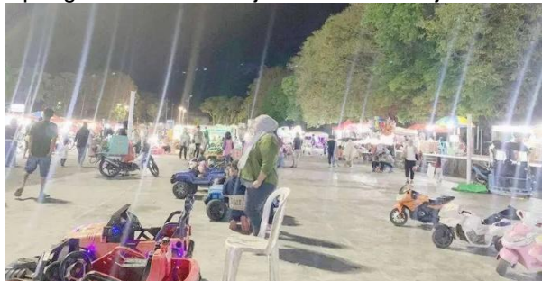
Gambar 9. Aktivitas Lapangan Taruna Remaja Gorontalo di Malam Hari

Tingkat kunjungan yang tinggi pada sore dan malam hari juga berkaitan dengan suhu iklim rata-rata Gorontalo. Secara umum, suhu rata-rata Gorontalo di siang hari berada di 32°C, sedangkan suhu di malam hari berada di 23°C. Suhu normal pada siang hari ini yang menyebabkan jumlah pengunjung Lapangan Taruna Remaja Gorontalo menjadi sedikit.