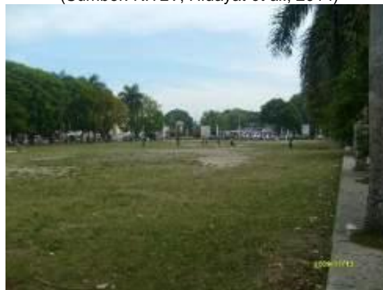
Gambar 2. Lapangan Taruna Remaja tahun 2009.