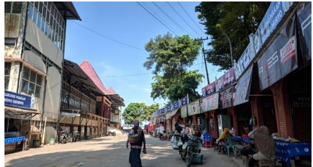
Gambar 4. Kios di Terminal Sunan Muria

Selain kios dagang, perekonomian lain yang menjadi mata pencaharian yang menjanjikan adalah ojek, tukang ojek Sunan Muria merupakan pekerjaan yang menjanjikan karena setiap hari ramai pengunjung untuk menyewa jasa ojek, biasanya jika pengunjung enggan berjalan kaki menuju makam Sunan Muria.