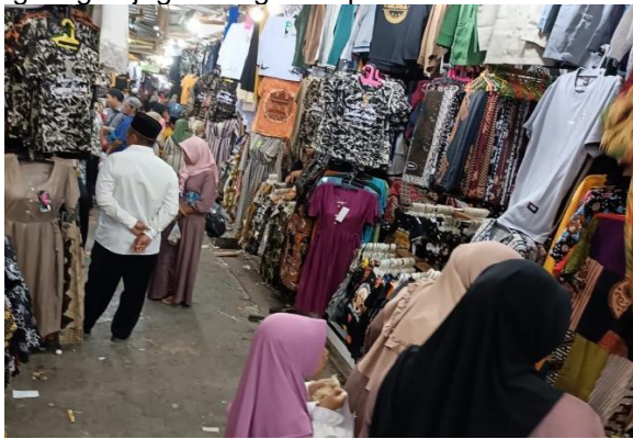
Gambar 3. Kegiatan Ekonomi di Kompleks Makam Sunan Muria

Selain perluasan serambi Masjid Sunan Muria, kegiatan pengunjung wisata Sunan Muria memberikan dampak yang sangat signifikan terhadap perkembangan ekonomi sehingga dengan adanya perkembangan ekonomi tata ruang lingkungan juga mengalami perubahan.