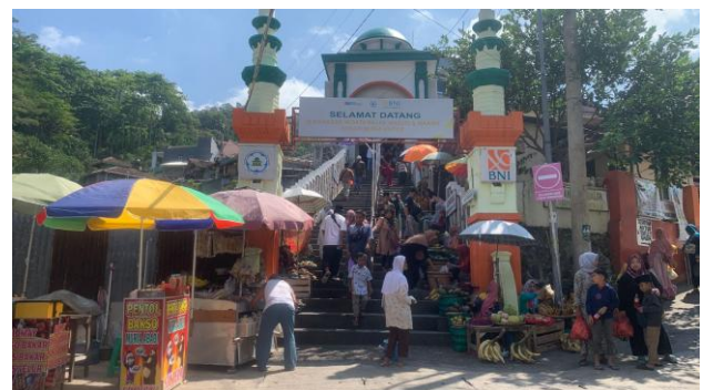
Gambar 8. Kesesakan pada Main Entrance Kompleks Makam Sunan Muria

Gambar 7. Kesesakan di Jalan Sunan Muria Kesesakan atau crowded yang terjadi di lingkungan Sunan Muria merupakan dampak dari kegiatan berwisata religi oleh wisatawan ke Makam. Mobil pribadi dan bus yang datang bersamaan membuat jalan satu-satunya menjadi sesak dan seringkali terjadi kemacetan selain itu jalan utama dan satu-satunya jalan yaitu jalan raya Suna Muria mengalami kerusakan karena kuantitas pengunjung yang sangat banyak. Pengunjung Kompleks wisata Sunan Muria yang datang dari berbagai daerah terutama dari luar Kabupaten Kudus menjadi target tersendiri untuk para pedagang, mereka memanfaatkan makanan dan buah-buahan khas Colo, yaitu buah parijoto, ui atau umbi talas rebus dan gedhang godhok atau pisang tanduk yang direbus. Para pedagang menjajakan dagangannya di kios sepanjang jalan menuju makam hingga pada awal pintu masuk makam yang mana merupakan main entrance untuk pengunjung hingga terjadi perubahan fungsi ruang, yang seharusnya sebagai akses pengunjung. Pada akhirnya jika sedang ramai pengunjung maka pada main entrance ini terjadi kesesakan dan menimbulkan ketidak nyamanan pengunjung.