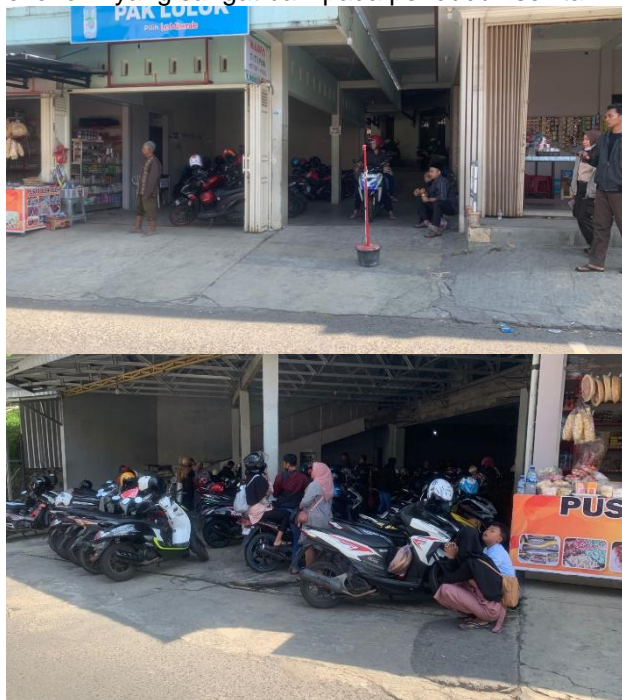
Gambar 9. Rumah-rumah yang Beralih Fungsi Menjadi Toko dan Tempat Parkir

dapat memanfaatkan apaotendi bangunan yang ada terhadap kompleks wisata. Tentu menjadi dampak ekonomi yang sangat baik pada penduduk sekitar.