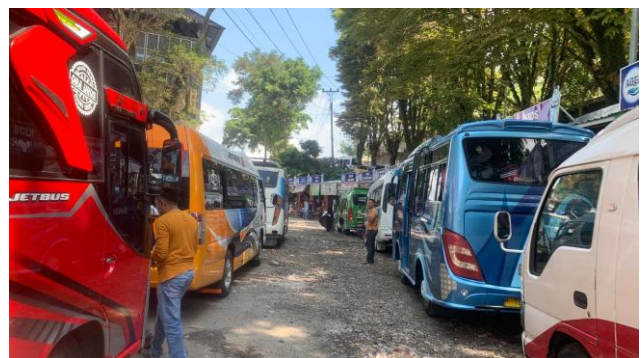
Gambar 5. Terminal Sunan Muria