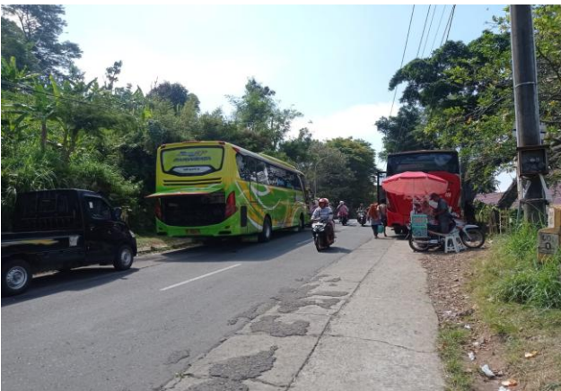
Gambar 6. Bus Parkir di Bahu Jalan.

Menurut Informan dampak dari kegiatan Pariwisata Sunan Muria yang lain adalah berubahnya tata ruang permukiman yang awalnya merupakan permukiman dengan berbasis perkebunan atau pertanian hingga saat ini berubah menjadi permukiman dengan berbasis industrial, terbukti dengan adanya koridor komersial yang padat di lingkungan sekitar kompleks wisata Tata ruang lingkungan sekitar dimana ruas