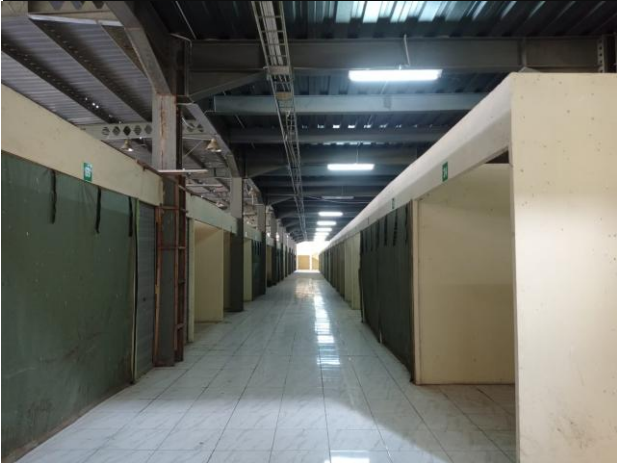
Gambar 6. Kios Dalam Terminal yang Tidak Terpakai Lokasi terminal Sunan Muria sesudah dibangun oleh pemerintah terlihat tidak seluas lokasi terminal dahulu, akibatnya Ketika ramai pengunjung banyak bus yang tidak kebagian tempat parkir. Lokasi terminal Sunan Muria terletak di bawah area makam atau dibawah main entrance menuju makam, tepatnya berada di bawah pertigaan jalan raya dengan jalan permukiman warga.