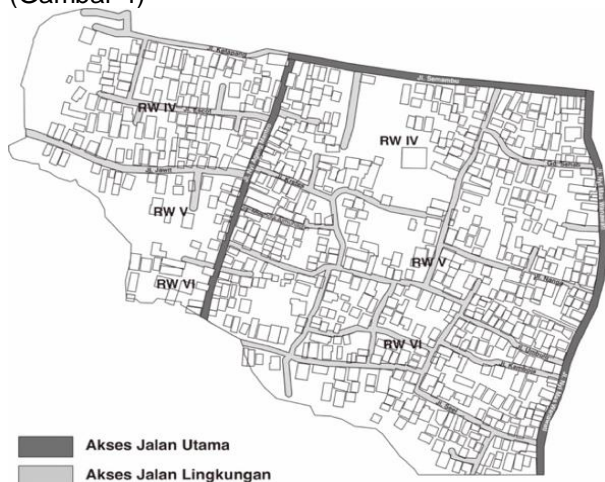
Gambar 4. Peta Jaringan Jalan Kampung Wisata Rotan Galmanthro

Aksesibilitas adalah kemudahan pencapaian dengan sistem transportasi yang merupakan salah satu pengembangan destinasi wisata (Cooper, 1995). Pencapaian ke Kampung Wisata Rotan Galmanthro tergolong mudah karena berada dekat dengan jalur utama. Terdapat tiga jalan utama dan jalan lingkungan di Kampung Wisata Rotan Galmanthro (Gambar 4)