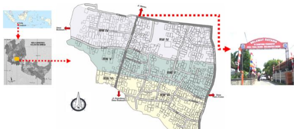
Gambar 1. Lokasi Kampung Wisata Rotan Galmanthro

Kampung Wisata Rotan Galmanthro berada di desa Tegalwangi, Kecamatan Weru, Kabupaten Cirebon, Jawa Barat. Kampung Wisata Rotan Galmanthro berada di lokasi yang strategis karena terletak di gerbang utama dari arah barat laut menuju kota Cirebon. Jarak dari kampung Galmanthro ke kota Cirebon sekitar 6 km. Kampung rotan Galmanthro berada di ketinggian rata-rata 5 meter diatas permukaan laut (Guritno & Manulang, 1999).