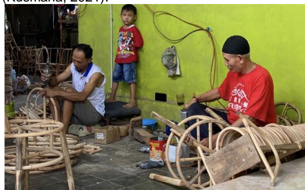
Gambar 3. Kegiatan produksi rotan di Kampung Wisata Rotan Galmanthro

Home based enterprises pada Kampung Wisata Rotan Galmanthro menjalankan usaha untuk memproduksi dan menjual kerajinan rotan (Kusmana, 2021).