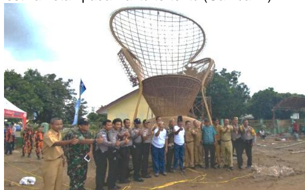
Gambar 2. Festival rotan di Kampung Rotan Galmanthro (Ispranoto, 2017)

Atraksi yang menjadi daya tarik di Kampung Wisata Rotan Galmanthro yaitu produksi kerajinan rotan, festival rotan dan seni tari topeng Cirebon (Kusmana, 2021). Wisatawan dapat melihat dan mempelajari (Richards, 2015) produksi kerajinan rotan di rumah produksi milik pengrajin, sedangkan untuk kegiatan festival dan seni tari hanya diadakan pada waktu tertentu saja di ruang terbuka. Fasilitas ruang terbuka dapat menjadi tempat untuk menciptakan pusat interaksi, hubungan sosial dan budaya (Putra, 2022). Terdapat ruang terbuka yang biasa digunakan untuk event kebudayaan seperti festival rotan pada waktu tertentu (Gambar 2)