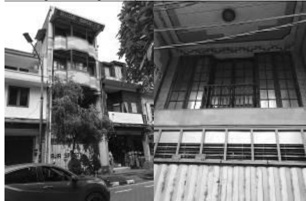
Gambar 7. Bangunan yang terbengkalai

Kondisi Kawasan heritage ini memiliki berbagai bentuk arsitektur bangunan tua dengan segala ciri yang khas. Namun dalam hal itu tidak bisa mudah untuk dipertahankan karena faktor usia bangunan, dan juga iklim yang membuat menurunnya kualitas bangunan. Selain menurunnya kualitas bangunan, hal tersebut juga membuat beberapa bangunan terlihat seperti tidak terawat dan bahkan ada yang terbengkalai begitu saja.