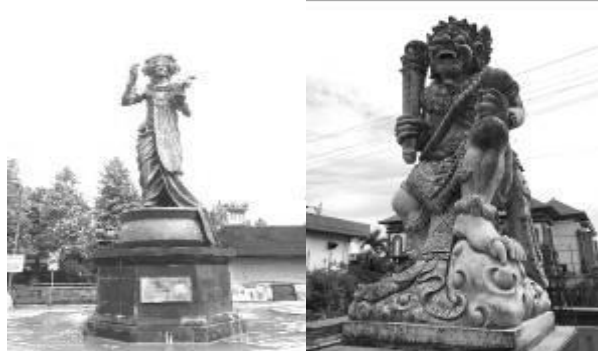
Gambar 4. Elemen kesenian patung

Pembangunan kawasan dengan penekanan kearifan lokal melalui kesenian juga diterapkan dengan menambahkan elemen kesenian berupa patung yang memiliki nilai estetika dan nilai identitas dari kawasan. Hal ini juga merupakan upaya yang tepat dalam menumbuhkan kearifan lokal Kawasan. Dimana dalam pembangunannya melibatkan generasi muda yang ada di kota Denpasar untuk dapat berkontribusi kepada pembangunan Kawasan heritage ini.