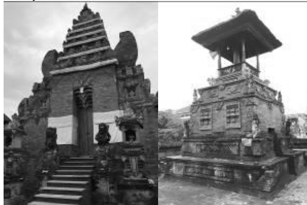
Gambar 3. Hasil konservasi Pura Desa Denpasar

Dalam elemen symbol budaya, kearifan mitos lokal berupa pemenuhan kebutuhan ritual dengan adanya adanya tempat ibadah berupa Pura adalah salah satu fokus dalam pembangunan di Kawasan ini. Pembangunan yang menyangkut dengan ini adalah dengan upaya konservasi Pura Desa Adat Denpasar dengan tetap mempertahankan nilai kesejarahan dan bentuk asli dari Pura tersebut.