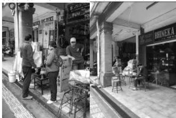
Gambar 2. Interaksi sosial masyarakat

hingga saat ini, terdapat juga adanya interaksi sosial berupa komunitas dan juga beberapa interaksi café yang membutuhkan ruang untuk duduk dan menikmati makanan dan minuman.