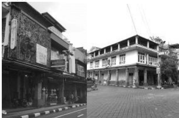
Gambar 1. Gaya Arsitektur Bangunan

Kawasan Heritage Gajah Mada memiliki identitas Kawasan dengan gaya arsitektur bangunan yang beragam. Terdapat 3 jenis gaya arsitektur yang ada di Kawasan ini, yaitu gaya Arsitektur Bali, Arsitektur Tionghoa dan Arsitektur Kolonial (dwijendra dan yudiantini, 2007). Ketiga jenis gaya arsitektur ini sangat terlihat jelas pada kawasan ini, dimana gaya arsitektur ini lahir dari perjalanan sejarah Kawasan yang tentunya dipengaruhi oleh adat, suku, ras yang pernah berperan dalam pembangunan kawasan ini.