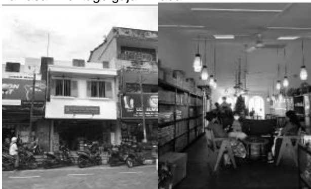
Gambar 6. Upaya konservasi bangunan tua

Salah satu bangunan yang baru-baru ini rampung dilakukan renovasi dengan mengembalikan bentuk bangunan kembali seperti semula adalah bangunan toko nadhi yang dibuat menjadi mixed used building berupa toko dan café , namun tetap mengedepankan nilai sejarah dan arsitektur dari kawasan heritage gajah mada ini.