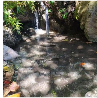
Gambar 2. Mata Air Tembeling (KKM Desa Batumadeg,2019)

keseluruhan dari debit total untuk menjaga kelestarian dan kontinuitas sumber mata air.