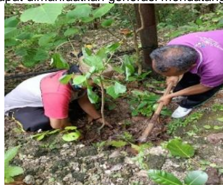
Gambar 4. Penanaman Vegetasi di sekitar mata air ( KKM Desa Batumadeg,2019)

Gambar 3. Mata Air Uhug (KKM Desa Sekartaji,2019) Selain itu, untuk menjaga ketersediaan dan mengurangi dampak dari menurunnya debit mata air yang dimanfaatkan, dilaksanakan juga kegiatan penanaman vegetasi disekitar mata air. Secara vegetasi, konservasi terhadap mata air merupakan salah satu cara untuk melindungi dan menjaga keberlanjutan sumber mata air. Penanaman pohon di sekitar sumber mata air di daerah yang relatif kering seperti dikepulauan Nusa Penida dapat melindungi dan mempertahankan keberadaan mata air. Hal tersebut dapat menjaga kuantitas air karena akar dari tumbuhan akan memperbesar pori-pori tanah sehingga tanah dapat menyerap air lebih besar melalui daya kapilaritas tanah. Selain itu, dengan adanya daun yang rindang dapat mengurangi tingkat penguapan air sehingga air akan tetap terjaga saat musim kering maupun musim hujan. Penghijauan ini diharapkan sebagai langkah konservatif dan preventif terhadap ketersediaan sumber mata air sehingga sumber air tetap terjaga dan dapat dimanfaatkan generasi mendatang.