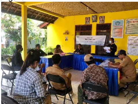
Gambar 7. Pelatihan KP-SPAMS (KKM Desa Batumadeg, 2021)

Salah satu kegiatan yang dilaksanakan pada program Pamsimas ini adalah pelatihan kader-kader pengelola dalam KP-SPAMS tersebut. Mereka secara berkala diberikan pengetahuan untuk mengelola dan terlibat aktif dalam proses pembangunan.