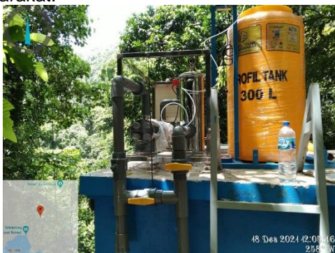
Gambar 6. Unit Ultraviolet (KKM Desa Batumadeg, 2021)

Untuk meningkatkan kualitas air yang dimanfaatkan, selain sudah dilaksanakan uji laboratorium terkait kualitas air bersih, program ini juga menambahkan kegiatan pemasangan mesin Ultraviolet sebagai unit filtrasi air bersih. Untuk menghindari pencemaran terhadap mata air, dikarenakan lokasi mata air terletak di bawah tebing, dilaksanakan kegiatan pembuatan pagar disekitar mata air agar kotoran tidak masuk kedalam mata air dan membatasi akses masyarakat.