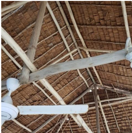
Gambar 5. Atap dari Bangunan Restoran Kopak Jaya 007

pembangunan ekonomi melalui investasi swasta (Shankar, 2015). Konsep tradisional lokal yang masih terlihat dari bangunan restoran ini dari baik dari bentuk bangunan serta penggunaan material seperti kayu bakau, jerami dan bambu yang merupakan sebuah daya tarik tersendiri sehingga perlu dilestarikan.