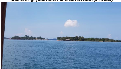
Gambar 3. Pemandangan ke Pulau sekitar Tiangwangkang