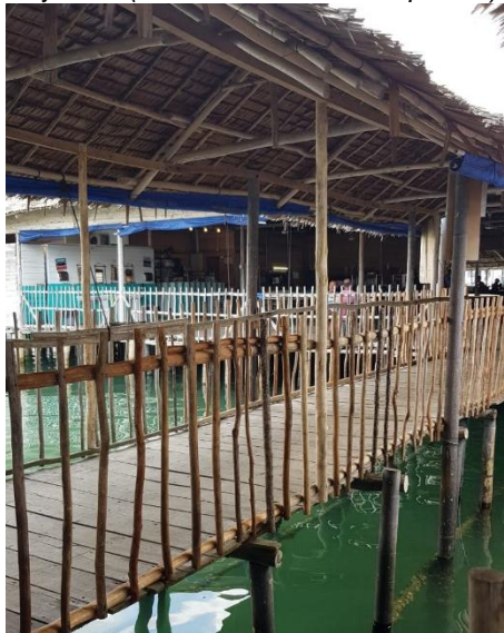
Gambar 6. Jembatan dari Restoran Kopak Jaya 007