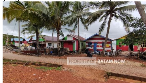
Gambar 7. Rumah Warna-Warni Kampung Tiangwangkang

ternyata dapat mengolah rumah warna-warni itu sebagai tempat penginapan atau guest house dengan pemandangan laut yang indah serta keunikan bangunan.