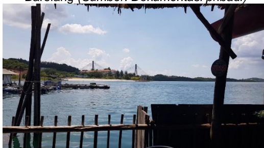
Gambar 2. Pemandangan ke Jembatan Bareleng