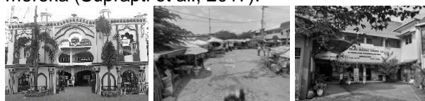
Gambar 1. Fasilitas di Kawasan Kauman

Self-sufficiency adalah memenuhi kebutuhan kota yang seoptimal mungkin, berkembang dari kegiatan produksi dan reproduksi kota itu sendiri. Dalam Kawasan kota Kauman telah terdapat komponen-komponen pelayanan serta sumber pembiayaan untuk masyarakat kampung Kauman. Di Dalam Kawasan kampung Kauman terdapat banyak fasilitas Pendidikan yang berbasis pendidikan spiritual dalam bentuk pondok pesantren dan ada pula fasilitas Pendidikan formal. Selain itu di kampung Kauman terdapat komunitas-komunitas sosial dan keagamaan yang mendukung kebutuhan sosial dan interaksi pada kampung Kauman. Kauman memiliki beberapa pertemuan sosial kelompok pengajian, seperti formal-informal, dan Lembaga pendidikan Islam tradisional modern, untuk semua lapisan masyarakat dari anak-anak hingga remaja. Itu pertemuan berfungsi sebagai alat untuk mengontrol serta mengembangkan modal sosial mereka (Suprpti et al., 2017).