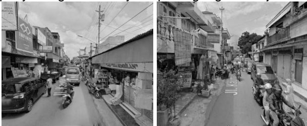
Gambar 4. Jalan Kauman

Penggunaan lahan di Kampung Kauman mendapatkan pengaruh dari perubahan serta perkembangan kawasan perkotaan yang terjadi secara signifikan. Hal ini dapat diketahui dengan adanya perubahan yang terjadi dalam hal guna lahan atau perubahan fungsi pada bangunan-bangunan di kawasan kampung Kauman. Kampung Kauman adalah lokasi yang sangat strategis, dikarenakan jarak yang tidak jauh dari tempat pusat perdagangan, jasa, dan perkantoran lingkup kota maupun regional. Penggunaan lahan pada kawasan ini terus mengalami perkembangan, hal itu berpengaruh pada aktivitas-aktivitas di yang ada didalamnya. Perubahan penggunaan lahan yang terjadi berfungsi guna mendukung aktivitas penyokong kawasan yaitu perdagangan dan jasa.