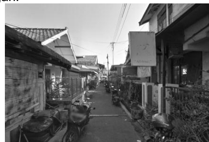
Gambar 3. Jalan di Dalam Permukiman

Modifikasi yang terdapat pada jalan-jalan di kampung kauman tidak terlihat begitu signifikan. Pada jalan-jalan di kampung kauman baik jalan bagian dalam maupun luar tidak terdapat modifikasi untuk kelebaran jalannya. Hal ini dipengaruhi oleh densitas yang ada di Kampung Kauman yang lumayan tinggi sehingga tidak adanya bidang lahan yang dapat digunakan untuk melakukan perluasan jalan. Selain itu, jika melihat dari aspek material perkerasan jalan, jalan utama pada kampung Kauman yaitu, Jalan Kyai H. Wahid Hasyim Jalan Pemuda, serta Jalan Kauman digunakan aspal sebagai material perkerasan jalan, kemudian pada jalan di dalam kawasan permukiman dalam kampung menggunakan paving block dan aspal sebagai material perkerasan jalannya. Untuk jalan utama pada Kampung Kauman tidak mengalami perubahan pada bentuk perkerasannya, namun hanya berupa perbaikan di titik-titik tertentu dengan tidak merubah material perkerasan yang digunakan. Namun perbaikan dilakukan beberapa kali di dalam kawasan permukiman dengan penggantian jalan aspal menjadi paving di titik-titik lokasi yang rawan genangan.